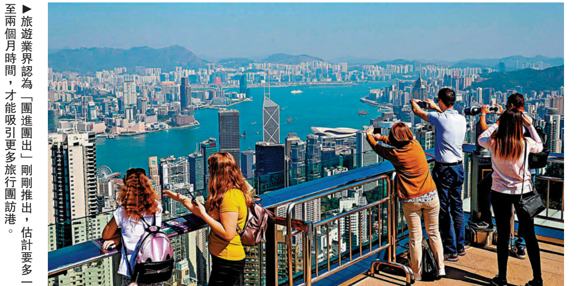
旅遊業界認為「團進團出」剛剛推出，估計要多一至兩個月時間，才能吸引更多旅行團訪港。

教育局發言人日前宣布，今年有43755名適齡兒童申請官立及資助小學的自行分配學位，有21724名兒童獲派此類學位，成功率達49.6%，較去年高2%，更是自2008入學年度51.8%以來的最高位，創近15年新高。其中屬於有兄或姊在該校就讀，或者父或母在該校任職類別共11790人，餘下9934人則屬按「計分辦法準則」分配類別。 教育局提醒，獲得自行分配學位的兒童，其家長須注意相關學校的註冊安排及註冊所需文件，例如小一入學申請表的家長副本及指定數目的兒童相片。家長必須保持社交距離及遵從相關的防疫措施，並於11月23、24日學校辦公時間內，辦理註冊手續。此外，未獲派學位的學童，明年2月可以參加統一派位，所有官立及資助小學，會有大約50%學額，留待統一派位階段時分派。