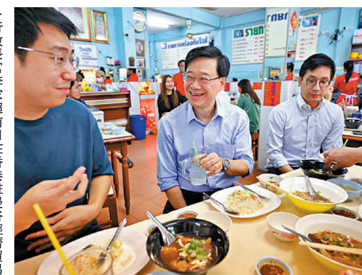
行政長官李家超前日在香港駐曼谷經濟貿易辦事處同事陪同下，到曼谷一間地道餐廳用早餐。

李家超上週四（17日）前往曼谷參加亞太經合組織（APEC）會議，潛伏期即確診前一至三天內，曾經出席多場會議及雙邊會談，後與印尼總統佐科維多多、新加坡總理李顯龍及越南國家主席阮春福等見面，其間全部人都沒有戴口罩。前日（20日）上午，他率領香港商貿代表團到訪多個地方，包括到曼谷市面小店吃早餐和逛雜貨店，之後參觀泰國一間大型企業，同日晚上結束行程返港。 行政長官辦公室回覆查詢時表示，李家超訪問曼谷四天期間，快速抗原測試結果均呈陰性，但返港後在機場的核酸檢測，結果呈陽性，正在禮賓府居家隔離，至於其他同行人士，包括陪同李家超出訪泰國的行政長官辦公室職員，機場的核酸檢測結果均為陰性。