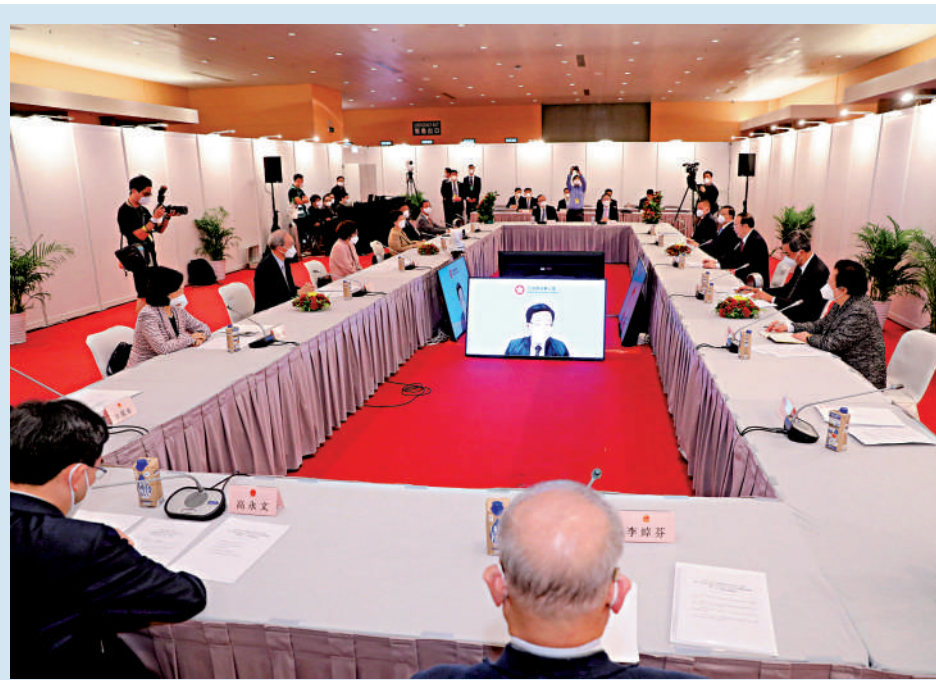
香港特別行政區第十四屆全國人大代表選舉會議第一次全體會議昨日在灣仔會展中心舉行，1107位成員出席會議。