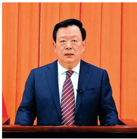
▲夏寶龍指出，特區政府要拿出更果敢的魄力，更有效的舉措積極破解土地房屋、扶貧助弱安老等方面的深層次矛盾和問題，讓廣大居民得到實惠。