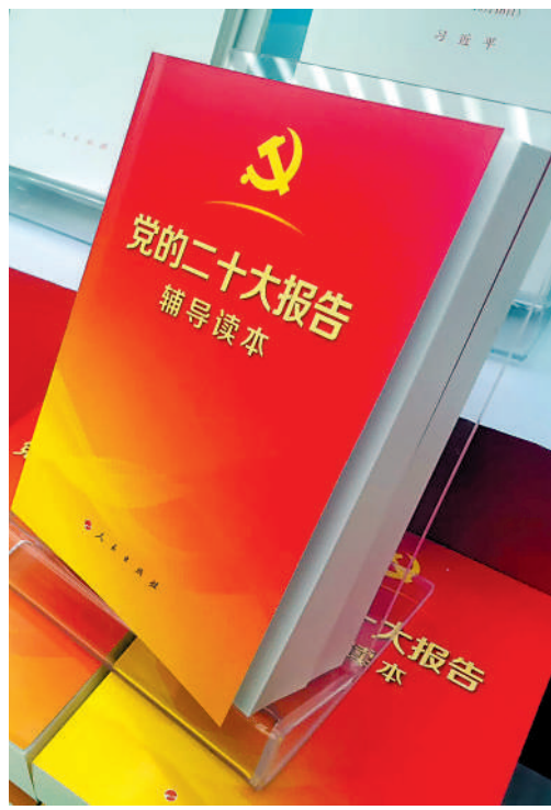
▶夏寶龍的署名文章《「一國兩制」這一好制度必須長期堅持》，收錄在《黨的二十大報告輔導讀本》中。