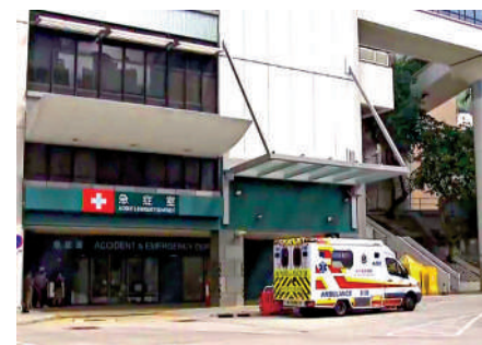
▲明愛醫院兩名病人投訴遭不當對待，警方拘捕護士。

醫管局強調非常重視病人安全，一向要求職員秉持嚴格的專業操守，若調查後發現事件中涉及任何不恰當行為，必定嚴肅跟進。