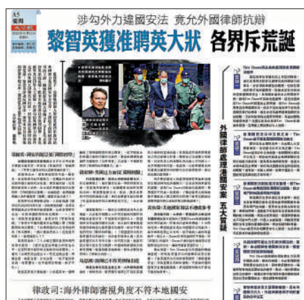
▲黎智英涉勾外力案件，竟獲准聘用英國大狀辯護，引起各界嘩然。

【大公報訊】亂港黑手、壹傳媒創辦人黎智英，先後涉及多宗案件，大部分案件已審結完畢，現時只餘下違反香港國安法的案件，定於12月1日開審。法庭早前批准黎智英從英國聘用御用大律師Tim Owen作代表，律政司不服，申請上訴至終院，上訴庭昨駁回上訴。