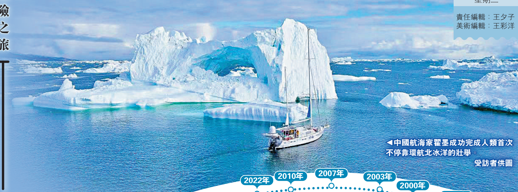
◀中國航海家翟墨成功完成人類首次不停靠環航北冰洋的壯舉。