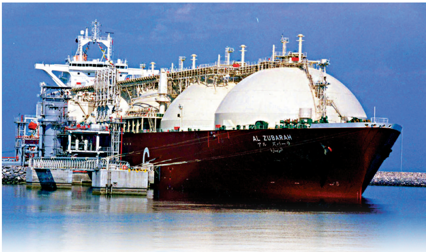
◀中石化與卡塔爾簽署LNG長期合約，圖為卡塔爾的LNG運輸船。