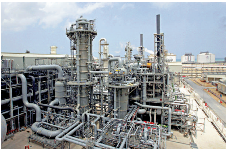
◀卡塔爾上世紀90年代押寶LNG，收入迅速增長。

2017年，卡塔爾再次下注，在全球討論減少使用化石燃料之際宣布增加北方氣田產能。俄烏衝突讓卡塔爾再次成為贏家，今年上半年，該國油氣收入激增三分之二，達到320億美元。