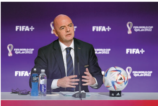
▲FIFA主席恩芬天奴表示，FIFA在卡塔爾世界盃週期的收入創新高。

此外，數據分析和諮詢公司Global Data數據顯示，萬達、海信等中國企業共贊助了近14億美元，超過美國企業成