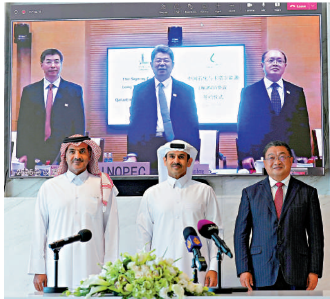
▶中石化與卡塔爾能源公司代表21日簽署LNG合約。

21日，中國石化董事長馬永生與卡塔爾能源事務國務大臣、卡塔爾能源公司總裁兼首席執行官卡阿比以線上形式共同簽署了為期27年的LNG購銷協議。這是中國石化與卡塔爾能源公司簽署的第二份LNG長期購銷協議，也是北方氣田擴能項目的第一份LNG長期購銷協議。