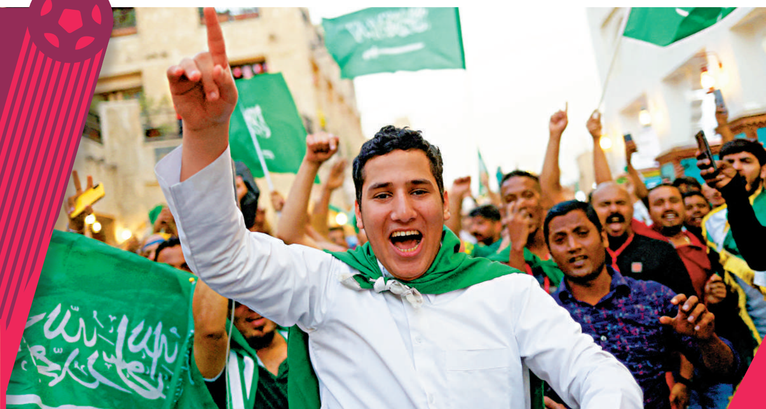
◀ 沙特阿拉伯球迷22日在球隊獲勝後狂歡。

【大公報訊】綜合法新社、《衛報》、半島電視台報導：卡塔爾世界盃比賽不斷爆冷，沙特在首場小組賽以2：1逆轉奪冠大熱門阿根廷，消息震驚全球。沙特在贏球後迎來了全民狂歡，國王下令全國放假一天慶祝。評論指出，這場比賽也成為沙特近年通過足球改善國際形象、擴大政治影響力的寫照，對於王儲兼首相穆罕默德·本·薩勒曼可謂是錦上添花。