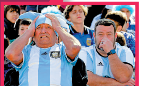
▲ 阿根廷球迷在球隊輸給沙特後感到震驚失望。