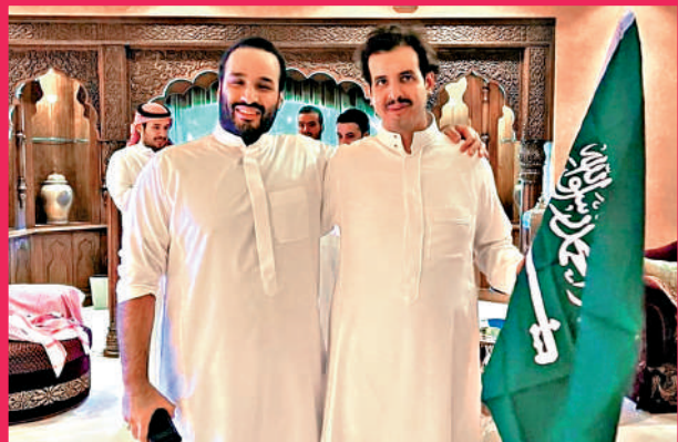
▲ 沙特王儲穆罕默德（左）22日高舉國旗慶祝球隊獲勝。

世界排名第51位的沙特在落後一球的不利情況之下，以2：1反勝阿根廷，創造了世界盃開賽以來的最大爆冷結果，也是世界盃歷年的最大冷門之一。阿根廷隊是僅次於巴西的第二大奪冠熱門，並自2019年起未曾敗績，輸給沙特前保持36場連勝。