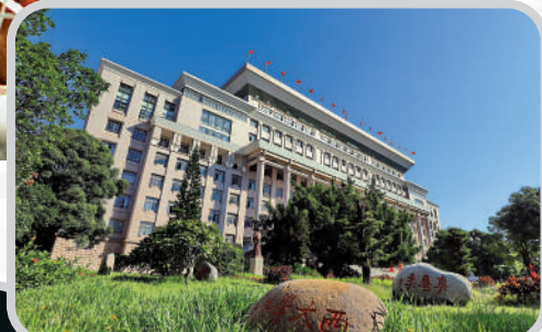
廣西大學動物醫學採用特色精品課程和本科生導師制培養方式，培養面向東盟與世界的複合型國際化人才。