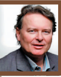
▲黎智英勾連外國勢力 擬聘英御用大狀 Tim Owen (圖) 來港為他辯護，引起社會極大爭議。