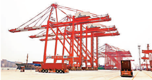
▲廣州港南沙港區建設「擴容」，圖為四期全自動化集裝箱碼頭。

據《公示》，廣州港股份為南沙港五期碼頭工程項目申請施工期用海，相比之前發布的消息，此次公示