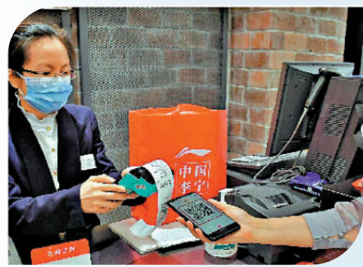
▲顧客在羅湖商店使用數字人民幣支付。