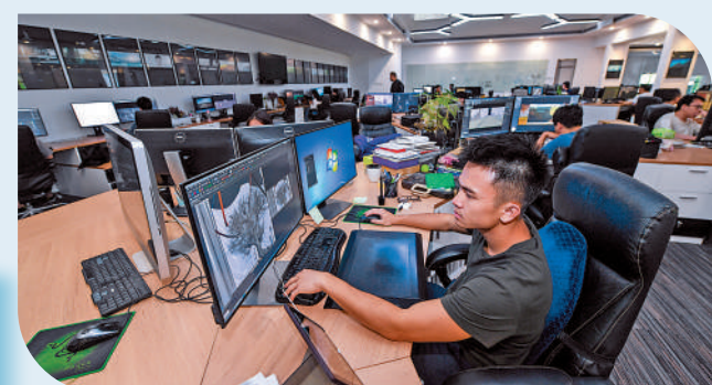
▲羅湖一家視效創意公司內，員工正在工作。