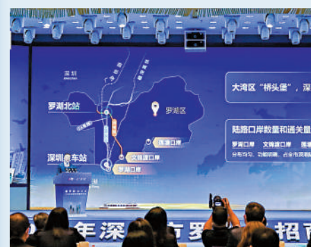
▲11月24日舉行的2022年深圳市羅湖區招商大會現場。

在他看來，羅湖是許多港人到深圳生活的第一站，他表示，羅湖打破舊城區的形象，開發大量新的發展空間，能夠為港青創業提供更多機會。他認為，除了科創、互聯網板塊，羅湖是深圳眾多城區中最適合做文化類產業的城區。「羅湖非常適合做文化類、餐飲，甚至電競類有文化附加值的行業。另外我亦希望羅湖未來在政策上、補貼上，服務上，可以為香港人到羅湖創業、工作提供更多的幫助。」