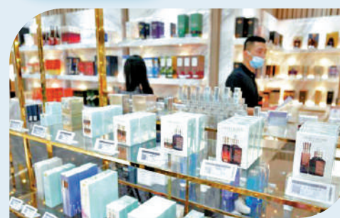
▲深圳近年銳意拓展免稅消費。

羅湖將通過開發過境土地，爭取免稅經濟、跨境商貿等特色政策，推動家居、建材等企業跨境經營。