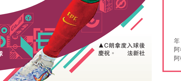
▲C朗拿度入球後慶祝。

最後還要運氣加持，球員十多年職業生涯總有傷病，他亦要保護自己不在世界盃前受傷，才能確保在賽事中上陣，強如法國名宿施丹，也因法國1994年不幸在外圍賽出局，使他要至26歲才首戰世界盃，荷蘭球王告魯夫因傷病影響，更只曾踢過1次世界盃，足見C朗今次紀錄難能可貴。