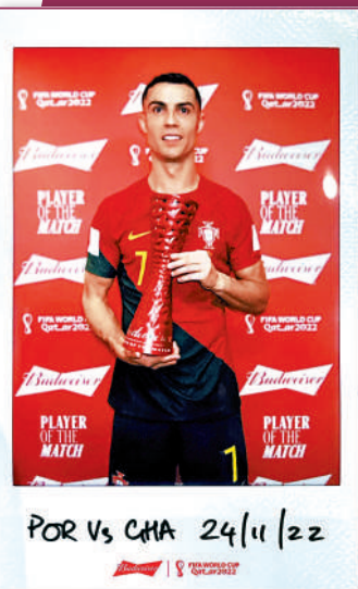
▲C朗賽後獲選為賽事最佳球員。

C朗拿度與阿根廷球星美斯一時瑜亮，兩人均自2006年世界盃起便從未缺席這個足球最高舞台，兩人最終同樣第5次出席世界盃，能在5屆世界盃中入選的球員歷史上只有8人，當中墨西哥門將奧祖亞首兩屆只作壁上觀，意大利傳奇門將保方首度入選亦只當後備，第5次入選的墨西哥球員古達度則未在今屆賽事上陣。能夠在5屆世界盃踏上足球場的只有5人，包括現年93歲的墨西哥門將卡巴查、德國經典中場兼清道夫馬圖斯、墨西哥中堅馬昆斯、美斯及C朗拿度。