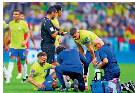
▲尼馬(前左)在比賽中受傷，狀甚痛苦。

塞爾維亞隊教練史杜高域表示：「我認為上半場兩隊是在一個水平線的，這個時間段我並沒覺得對方很有統治力。」「下半場我們在體能上出了問題，這出乎我的意料。輸給巴西隊並不丟臉，他們配得上這場勝利。」史杜高域說。