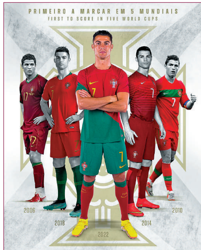
▲葡萄牙足總在賽後貼出「C朗成就」海報。