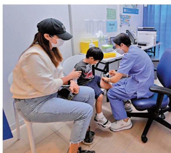
▲現時新冠疫苗幼兒接種率只有20.3%，專家呼籲家長盡快帶子女打針。

前錄得76宗個案，數字一度回落，但本周再接到五、六宗個案通報，他擔心該病症再次出現，現時半歲至3歲兒童的新冠疫苗接种率只有約20%，他呼籲家長盡快帶子女打針。 首批77萬劑二價疫苗抵港 政府已向藥廠採購共190萬劑復必泰二價疫苗，首批約77萬劑昨日抵港，餘下的劑量預計於下月底運送抵港。政府將於稍後公布二價疫苗接種安排，按專家建議，12歲或以上人士可於第四針、確診康復人士可於第三針選擇接種二價疫苗，而50歲或以上人士應接種第四針。 政府昨日推出新一輪院舍外展疫苗接種服務特別計劃，為期四周。外展接種隊將每周到訪院舍最少一次，為到期打針的院友接種，特別是打第四針，同時接種流感針。