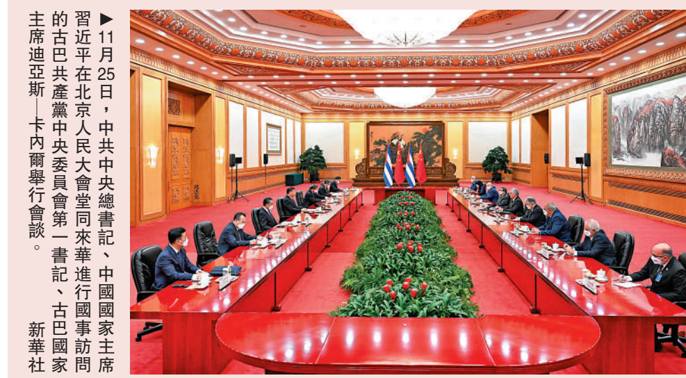
▶11月25日，中共中央總書記、中國國家主席習近平在北京人民大會堂同來華進行國事訪問的古巴共產黨中央委員會第一書記、古巴國家主席迪亞斯—卡內爾舉行會談。