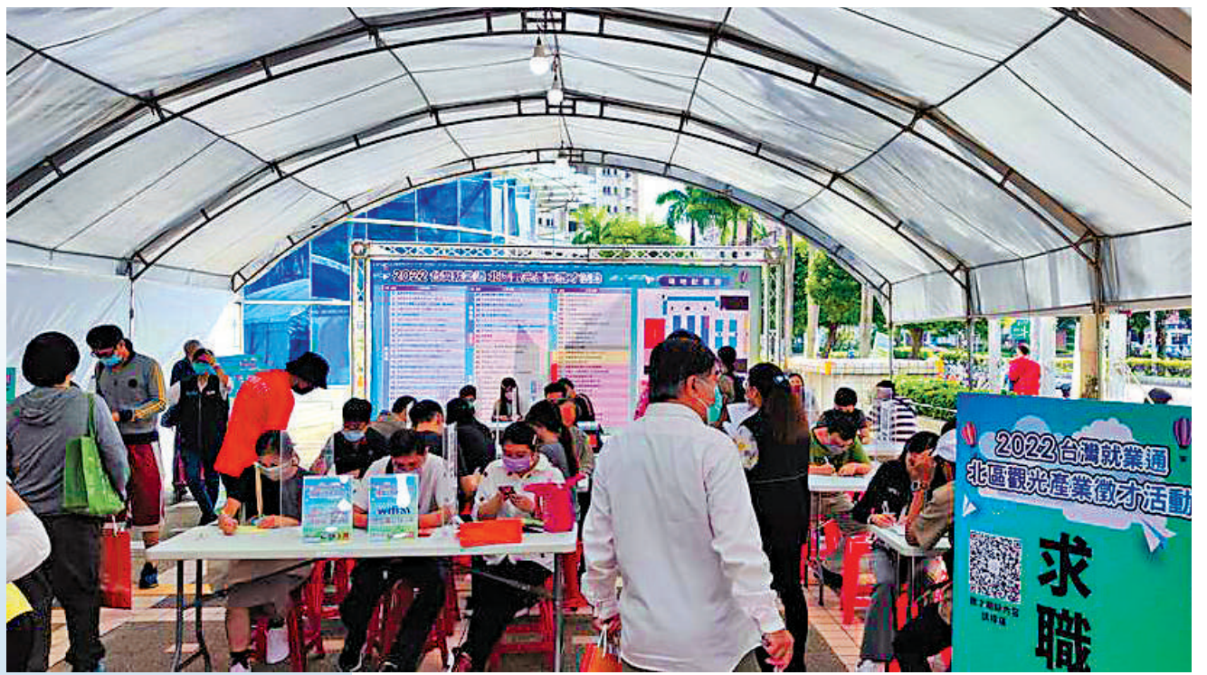
▲台灣地區觀光酒店業迎復甦，缺工問題卻成絆腳石。圖為島內觀光酒店業招聘會，應聘者寥寥無幾。