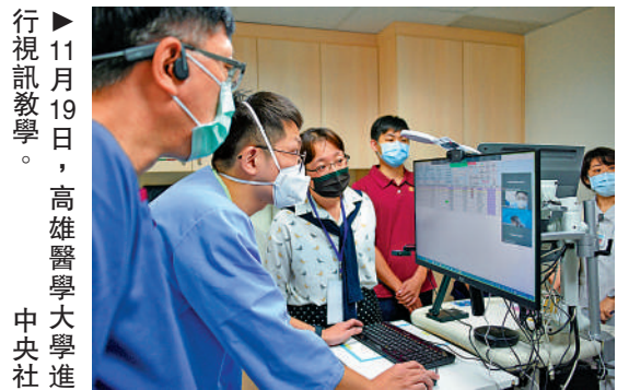
▶11月19日，高雄醫學大學進行視訊教學。

有分析指出，在兩岸關係緊張的當下，民進黨當局明知美台軍事互動高度敏感卻刻意公開，只會加劇台海局勢緊張。同時，兩岸軍事實力的天平早已傾斜且不可逆轉，台軍拉美國給自己「壯膽」，不過是其心虛的表現。民進黨當局為了升高兩岸對抗，小動作不斷，最終只會玩火自焚。