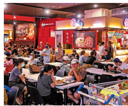
▲新北市民眾在新店區一家賣場美食街用餐。

島內學者李正圻則認為，民進黨上台後，不把精力放在發展經濟改善民生、兌現選舉「承諾」上，而是用到政治鬥爭、操弄民粹，挑撥兩岸關係，把台灣搞得危機四伏。當下台灣青年無論怎麼努力，薪資成長都趕不上物價飛漲速度，有的年輕人連基本生活都面臨困難，這讓年輕人看不到人生的希望，於是不願意做辛苦的工作。這是台灣現實政治社會環境的映射，這都與民進黨當局的各種倒行逆施不無關係。