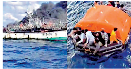
▲11月6日，台灣漁船「祥慶號」在北太平洋突然起火，中國大陸漁船成功救起48名船員。資料圖片

有進行搜尋救助的義務。對台合作成為該條例的突出亮點。該條例明確，海上搜救中心應當加強與台灣地區海上搜救機構的交流與協作，健全兩岸海上搜尋救助協作機制，暢通信息通報渠道，組織海上搜尋救助交流研討和聯合演練。鼓勵台灣地區社會力量參與閩台海上搜尋救助協作。海上險情涉及台灣同胞的，有關部門要在辦理出入境手續、醫療救助、生活保障等方面提供便利。