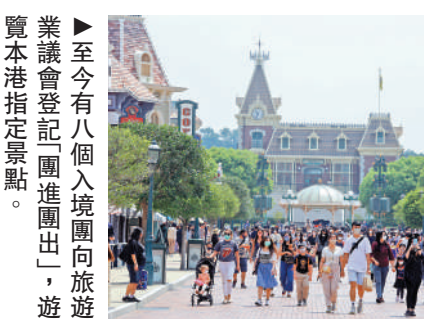
▶至今有八個入境團向旅遊業議會登記「團進團出」，遊覽本港指定景點。

文化體育及旅遊局局長楊潤雄相信12月會有更多旅行團來港，他又認為本港旅遊業具競爭力，只因防疫措施較為嚴苛，短期內對旅遊業的帶動或未及預期。他又指，目前可發展綠色本地遊及文化古蹟遊等，正與郵輪公司商討，相信明年會有措施方便郵輪來港泊岸等，郵輪公司反應正面。