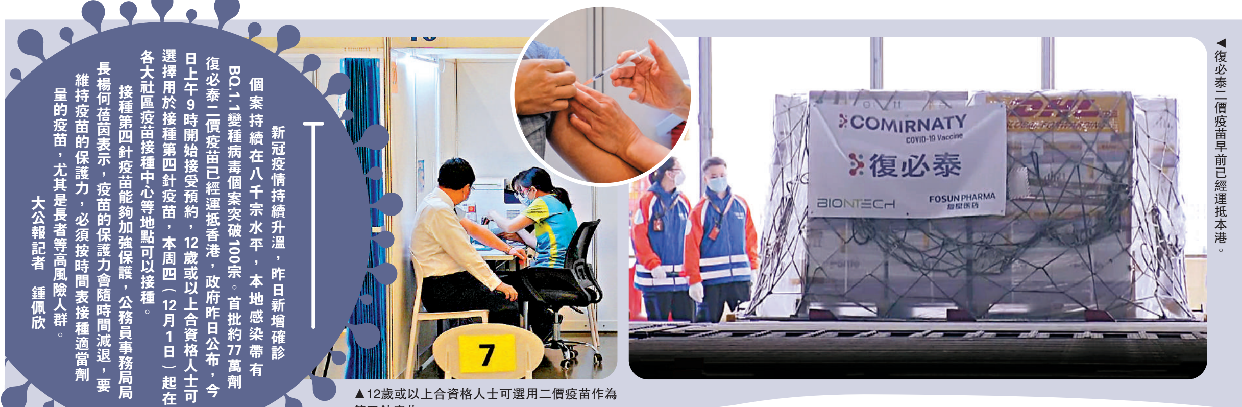
▲復必泰二價疫苗早前已經運抵本港。

新冠病毒持續升溫，昨日新增確診個案持續在八千宗水平，本地感染帶有B.1.1.5變種病毒個案突破100宗。首批約77萬劑復必泰二價疫苗已經運抵香港，政府昨日公布，今日上午9時開始接受預約，12歲或以上合資格人士可選擇用於接種第四針疫苗，本周四（12月1日）起在各大社區疫苗接種中心等地點可以接種。