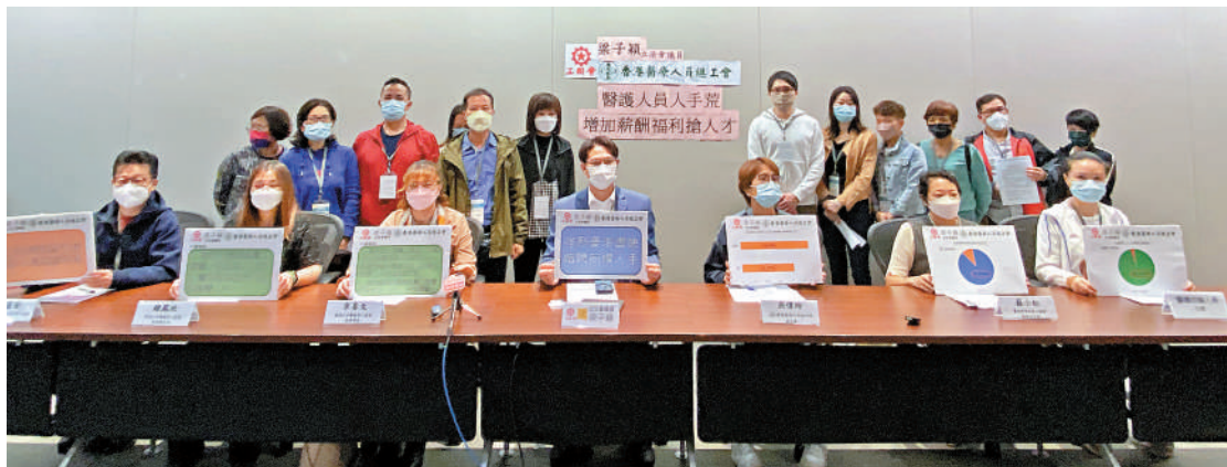
▲工聯會要求醫管局正視前線醫護及支援人員的訴求，盡快增聘人手、改善工作環境及工作待遇。