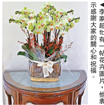
▲李家超fb有一帖花卉圖片，他表示感謝大家的關心和祝福。