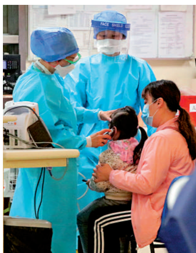
▲97%的受訪前線醫護表示疫情期間工作量增加。