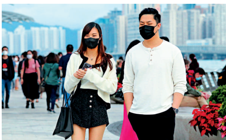
▲未來一周氣溫將會急降，市民的冬衣終有用武之地。

【大公報訊】經歷過毫無冷意的「小雪」節氣後，香港終於要降溫了。天文台預測，未來一周氣溫將會急降，預料一道冷鋒會在29日（周二）稍後至30日（周三）早上橫過華南，其間氣溫由最高28°C急跌12度，至最低的16°C，12月1日（周四）起一連兩天的氣溫更會降至14°C。要到12月4日（周日），氣溫才會回升至最高21°C。