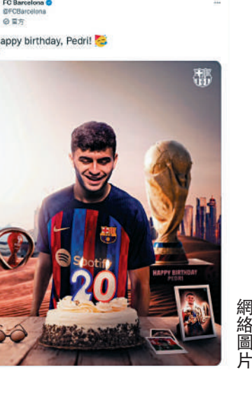
▲巴塞隆拿官方推特亦發帖為柏迪慶生。

柏迪能夠取得如此成就，腳下工夫出色之外，與年紀不相稱的成熟心態更是關鍵，才能夠無懼任何大場面，保持冷靜踢出應有水準。柏迪透露：「我甚少感到緊張，步入球場之際，只希望他可以像兒時踢球一樣，好好享受比賽。這並不代表我沒有取勝決心，因為取勝是卡塔爾的傳統運動，但當你身在世界盃現場，就會不自覺地被氣氛所感染。」