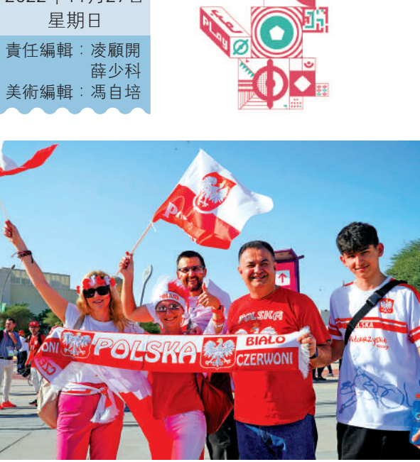
▲波蘭球迷對利雲度夫斯基充滿信心。