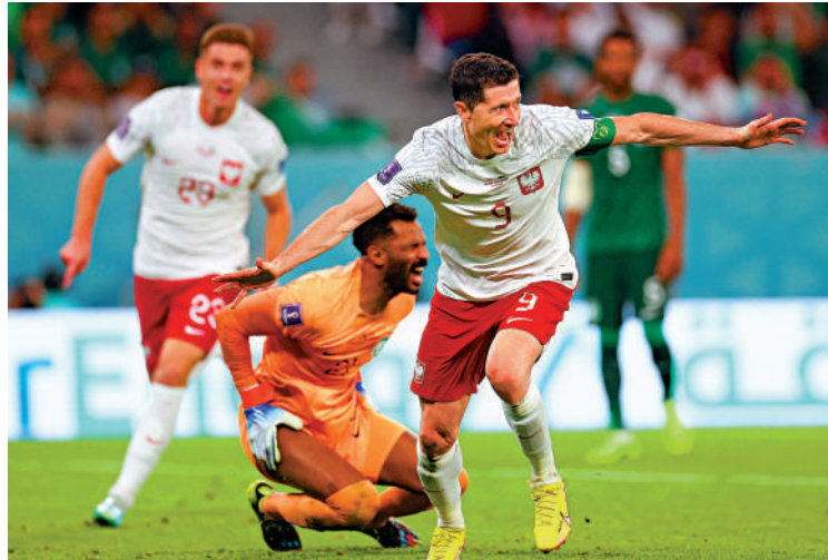
▲利雲度夫斯基(右)以入球彌補首戰宴客之失意。

【大公報訊】特派記者郭正謙報道：C組次輪波蘭對沙特阿拉伯昨晚舉行，首輪賽和的波蘭為搶3分發動猛攻，上半場由施連斯基先開紀錄，之後波蘭輸12碼，門將施捷斯尼連環撲救保住一球領先優勢。下半場，沙特不斷射門，但仍逃不過施捷斯尼的防守，波蘭更有羅拔利雲度夫斯基射入個人在世界盃決賽首個入球，終以2:0報捷，兩戰積4分。踢至39分鐘，波蘭一次快攻，輾轉至右路傳中，利雲度夫斯基接應挑射被撲出，他追回皮球傳中後，施連斯基直射破網成1:0。補時1分鐘，沙特的艾舒希利在禁區內被基斯甸比歷臣犯而博得12碼，艾達沙尼主射被施捷斯尼救出，艾貝歷克補射又被施捷斯尼擋出，半場波蘭一球領先。沙特下半場嘗試反擊，穆罕默德簡奴51分鐘射門斜出，4分鐘後，艾舒希利射門又被撲出，艾馬爾基再射卻高出。82分鐘，利雲度夫斯基乘對手犯錯搶走皮球輕鬆近門射成2:0至完場。