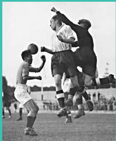
對戰。▲李惠堂率領中國隊與英國隊在柏林奧運會