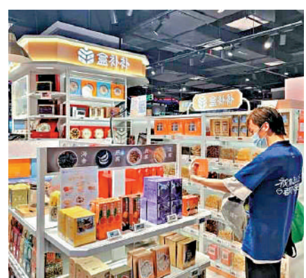
▲世界盃拉動了滋補品的銷售。

喝着咖啡提神，中國球迷也在搜「熬夜之後怎麼辦？」盒馬「熬夜滋補」類商品明顯增長，裝有一整根人參的「一整根 熬夜水」銷量預計世界盃期間將同比增長35%，不少人還會二次利用裏面的人參續杯或煲湯。