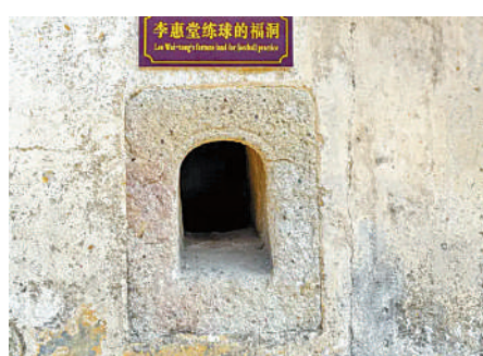
▲李惠堂童年練球的狗洞。

17歲的李惠堂，在南華體育會舉辦的「夏令營盃」校園足球賽上，引起了時任香港足球總會執委莫慶的注意，並很快被吸收為南華會甲級球員。從此，李惠堂開始了「一腔肝膽存人熱，半世風塵為國爭」的足球職業生涯。他馳騁足壇二十五載，足跡遍及亞、歐、澳洲，數次率中國國足參加奧運會、遠東運動會等國際性比賽1000多場，進球1860個，獲近百枚獎章和120多座獎盃，堪稱世界之最。1976年8月13日，李惠堂與巴西比利、英國馬菲士、阿根廷迪史提芬奴、匈牙利普斯卡斯被評為「世界五大球王」，成就了中國國足的高光時刻。