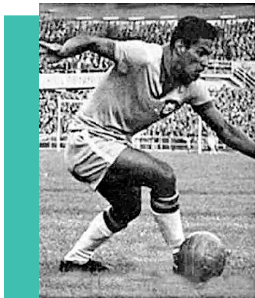
精準。▲李惠堂在球場上擔任前鋒，腳法神速，攻門