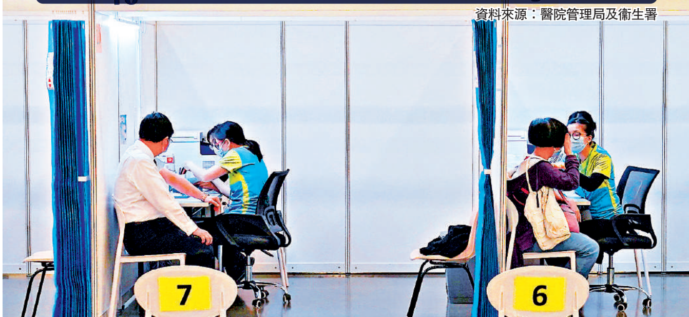
▲專家建議即將外遊的人士應提早打二價疫苗，可更快產生抗體。