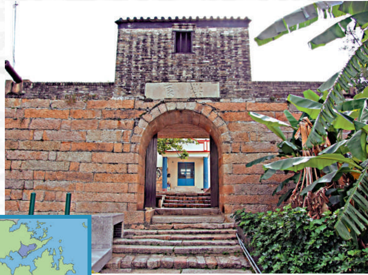
▲清朝道光年間，為阻止鴉片貿易和海盜侵略，當時的清朝水師把附近的大鵬營升為大鵬協，下設左右二營，總部及左營設於深圳的大鵬所城，而右營則是駐在新建的東涌所城。