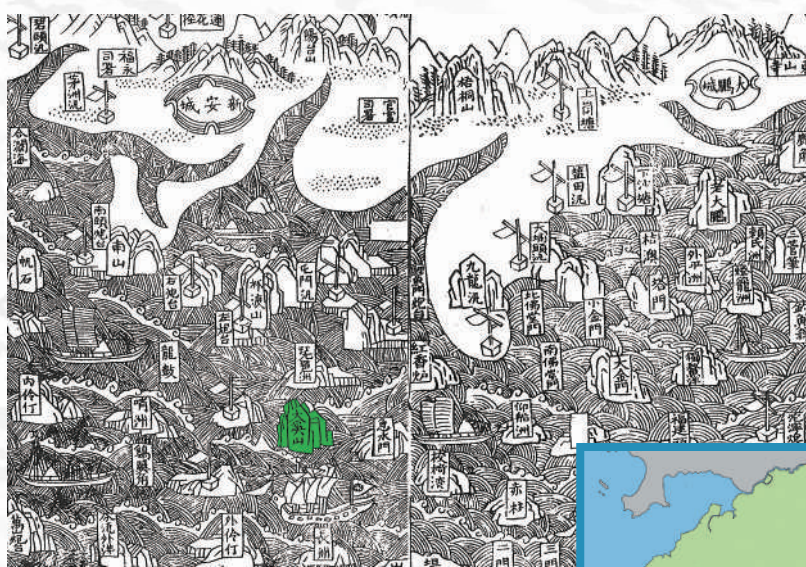
▲嘉慶二十四年（1819）《新安縣志》中的《新安縣海防圖》，標示仍用大奚山。

宋代大嶼山以產鹽出名，北宋以來原為海南鹽柵所轄；南宋紹興年間（1131-1161），該地曾為土著朱祐所據，朱祐投誠後，少壯者被選為水軍，老弱者則放歸。寧宗慶元三年（1197），提舉徐安國緝捕鹽梟於島上，島民由萬登領導抵抗；其後，廣州經略錢之望遣兵入大嶼山，盡殺島民，且墟其地。事平，留兵三百戍守。元代，島上復聚居民數百家。事見元吳萊《南海古蹟記》〈大奚山〉條。明天順盧祥《東莞縣志》載：「……居民不事農桑，