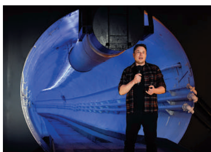
▲ 馬斯克2018年12月在加州一條測試隧道的揭幕儀式上講話。

「無聊公司」前高管29日透露，該公司的企業文化推崇「超長工作時間」，工程師和技術人員已紛紛離職。據悉，馬斯克此前曾表示自己每週會工作120個小時，並睡在工廠和辦公室。這種企業文化與馬斯克入主後的推特如出一轍。馬斯克收購推特後，要求員工要麼接受「高強度、長時間」的工作，要麼拿着三個月的遣散費走人。