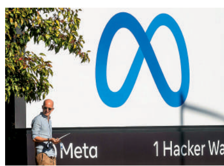
▲ Facebook母公司Meta已因隱私洩露問題被DPC罰款近80億。

以決定是否提起上訴。這也是DPC第四次對Meta旗下公司開罰，在過去一年多內，DPC已經對Meta及旗下社交軟