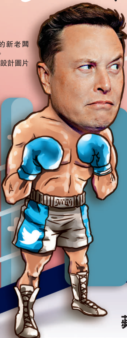
▶ 推特的新老闆馬斯克。設計圖片

馬斯克透露，蘋果還威脅稱可能會把推特從其應用商店中下架，且「沒有告知我們原因」。他26日聲稱，如果蘋果和谷歌從各自的應用商店下架推特，他將打造自己的手機。分析指，如果蘋果公司想做的話，它將從蘋果手機的應用商店下架。這對推特將是一個毀滅性的打擊。目前蘋果還不打算跟馬斯克「撕破臉」。庫克本人也在繼續使用推特，上週還發文祝自己的粉絲感恩節快樂。