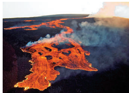
▲ 夏威夷莫納羅亞火山27日時隔38年後首次噴發。

有跡象表明需要撤離住在火山裂谷帶的居民。裂谷帶是山脈開裂的地方，通常地殼比較薄弱，容易開裂冒出岩