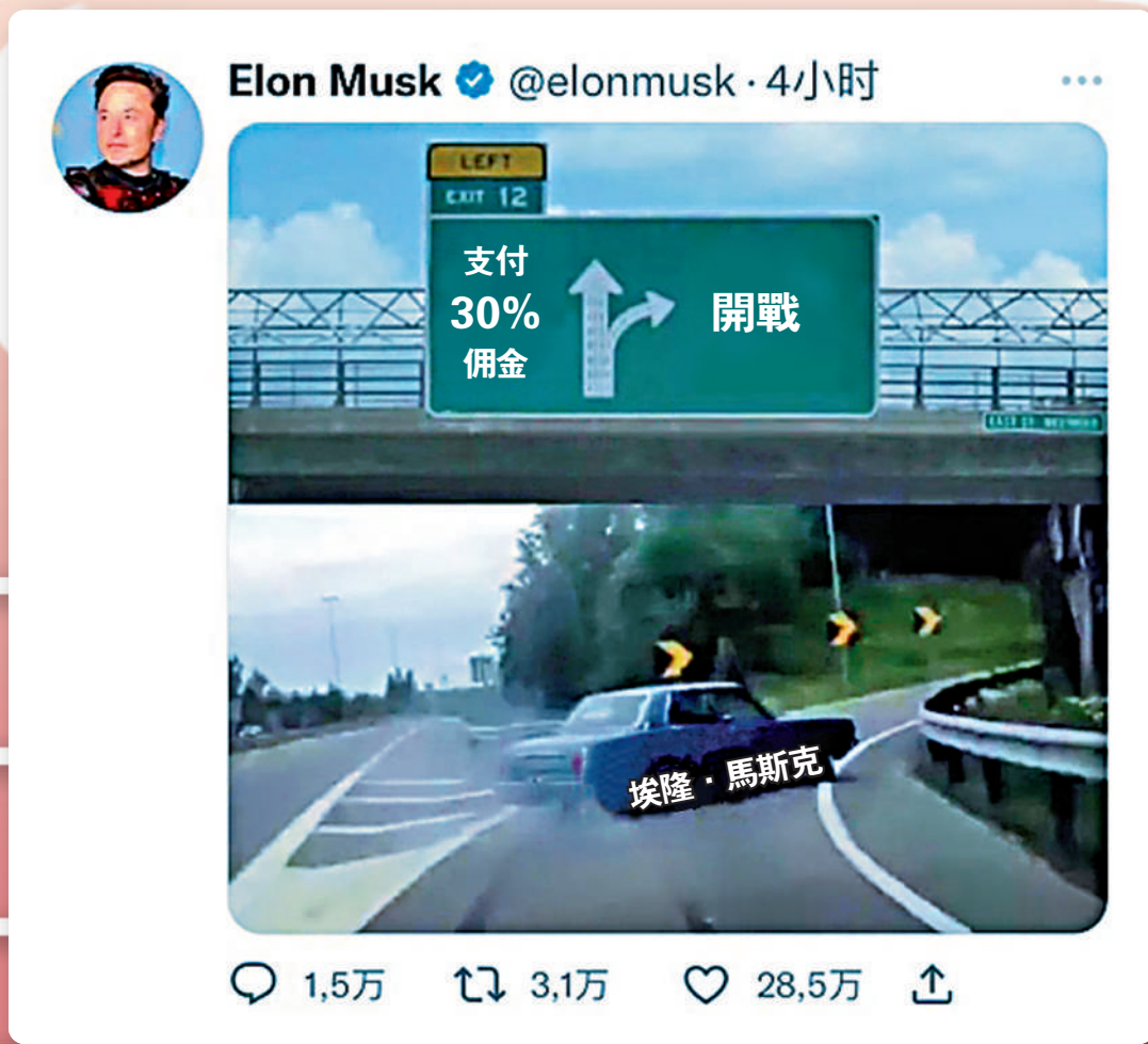
▲ 馬斯克28日在推特發布一張象徵與蘋果「開戰」的圖片後又刪除。