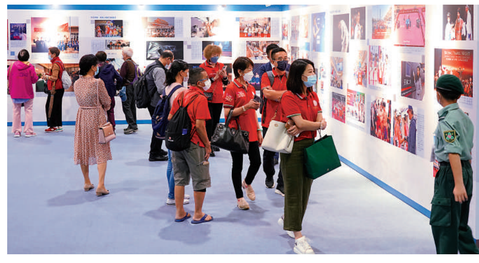
▲入場參觀人士絡繹不絕。