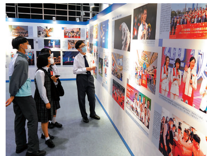
▲學生對展板內容深感興趣，看得津津有味。