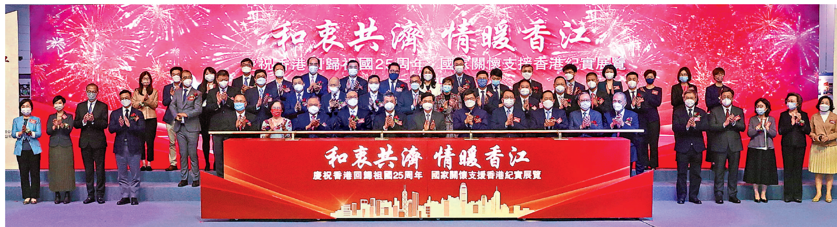
▲「和衷共濟 情暖香江——慶祝香港回歸祖國25周年國家關懷支援香港紀實展覽」昨日隆重開幕。行政長官李家超與一眾嘉賓出席開幕儀式。