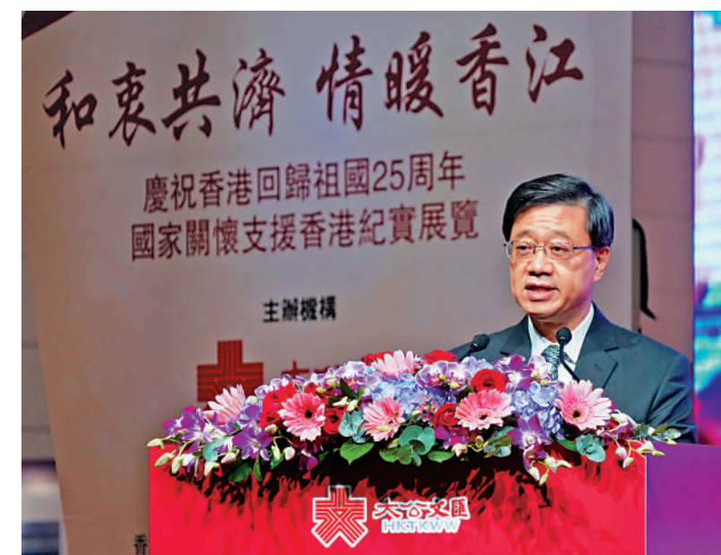
▲李家超表示，無論香港經歷了什麼考驗，國家始終是香港最堅強的後盾，與香港風雨同舟，渡過一個又一個的難關。

李家超致辭表示，二十大上月順利閉幕，二十大報告從全局和戰略的高度，全面總結了「一國兩制」實踐取得的歷史性成就，充分體現了「一國兩制」是全面維護國家主權、安全利益的好制度，是保持香港長期繁榮穩定的好制度，更是保證香港居民根本利益和福祉的好制度。回歸25年來，香港面對種種嚴峻的挑戰，前有金融危機和非典疫情，2019年有黑暴「港獨」和外部勢力干預香港內部事務所帶來的疾風暴雨，以及新冠疫情對香港帶來的衝擊，無論香港經歷了什麼考驗，國家始終是香港最堅強的後盾，始終與香港風雨同舟，渡過一個又一個的難關。