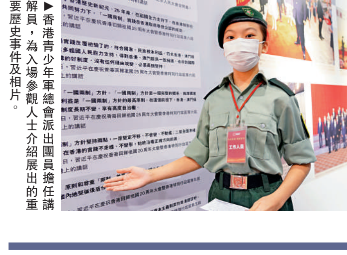
▲香港青少年軍樂隊派出團員擔任講解員，為入場參觀人士介紹展覽的重點歷史事件及相片。