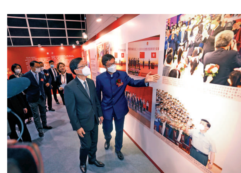
▲行政長官李家超在王凱波陪同下參觀展覽。

此次展覽在灣仔香港會展中心舉行，展出715幅圖片，以小故事講述大歷史，以小細節呈現大時代，通過豐富的圖文史料、生動的歷史瞬間，全方位展示香港在國家深切關懷和全力支持下的非凡歷程，一連三日（11月30日至12月2日）對公眾開放，會場設有青少年軍樂隊，昨日已吸引不少學校師生及各大社會團體前來參觀，廣大市民同時亦可於12月3日起在網上觀看全部展出內容。