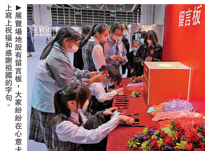
▲展覽場地設有留言板，大家紛紛在心願卡上寫上祝福和感謝祖國的字句。