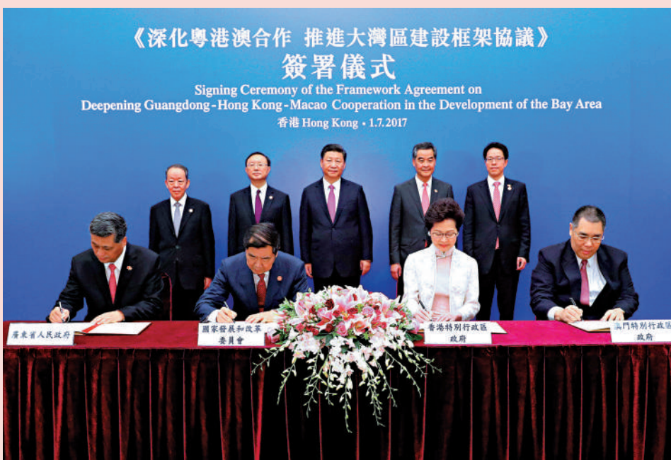
▲2017年7月1日上午，在習近平見證下，《深化粵港澳合作 推進大灣區建設框架協議》在香港正式簽署。

▲2022年3月16日，應香港特區政府請求，由內地支援香港抗疫工作專班派遣的內地援港醫療隊共300名隊員，經深圳蓮花口岸啟程赴香港。