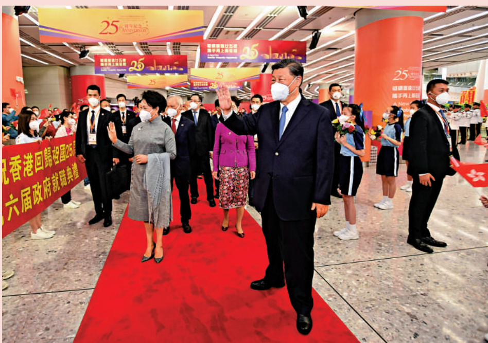
▲2022年6月30日下午，習近平總書記和夫人彭麗媛抵港，向歡迎的人群揮手致意。