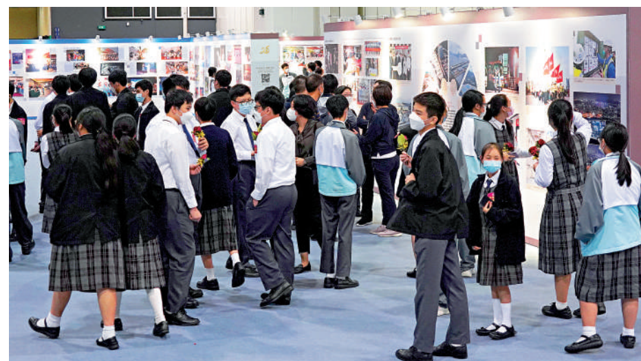
▲大批學生到場參觀，學習氣氛濃厚。