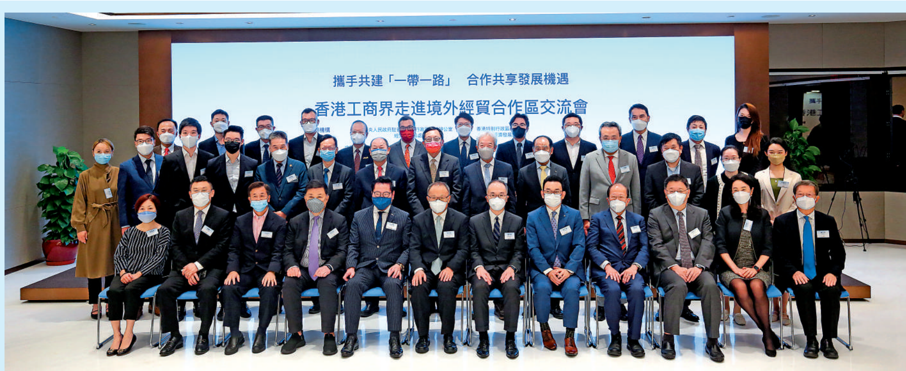
▲中聯辦經濟部貿易處攜手特區政府商務及經濟發展局，昨日以線上線下相結合的方式聯合主辦交流會。圖為出席嘉賓合照。