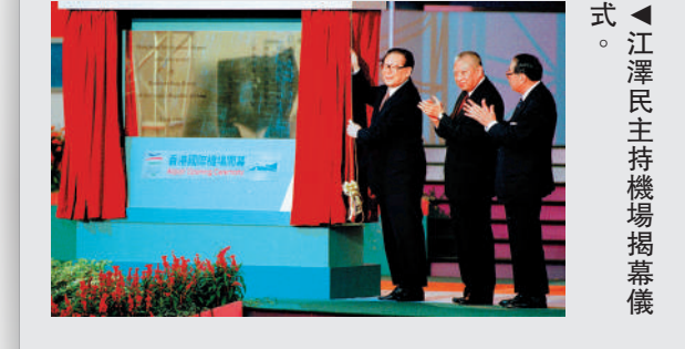
▲江澤民主持機場揭幕儀式。

出席活動 ● 出席香港回歸祖國一周年慶祝大會，主持赤鱲角香港國際機場揭幕儀式，視察解放軍駐港部隊等。