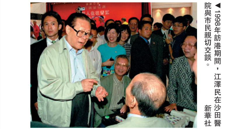
▲1998年訪港期間，江澤民在沙田醫院與市民親切交談。

你好。我想和你握個手。」江澤民抱拳笑着說：「我很想和你們每一個人都握手。我就這樣謝謝大家了。」人群報以熱烈的歡呼。 有媒體評論，身為國家領導人的江澤民，深入香港社區，了解民眾心聲，掌握民意脈動。這些親民之舉，讓香港百姓如沐春風，充分反映了中央領導人對香港同胞的融融關愛，體現他對香港民眾的安危冷暖念茲在茲，時時刻刻都把香港民眾放在心上。 1997年7月1日，出席香港回歸祖國慶典的江澤民，把在6月18日親筆書寫的「香港明天更好」六個大字，作為對香港特區持續繁榮穩定的祝福。如今，25年過去了，無數事實已經證明並將繼續證明，這一美好願景已經轉化為現實情境，有力詮釋著「一國兩制」實踐的成功範本。 大公報記者 鄭曼玲