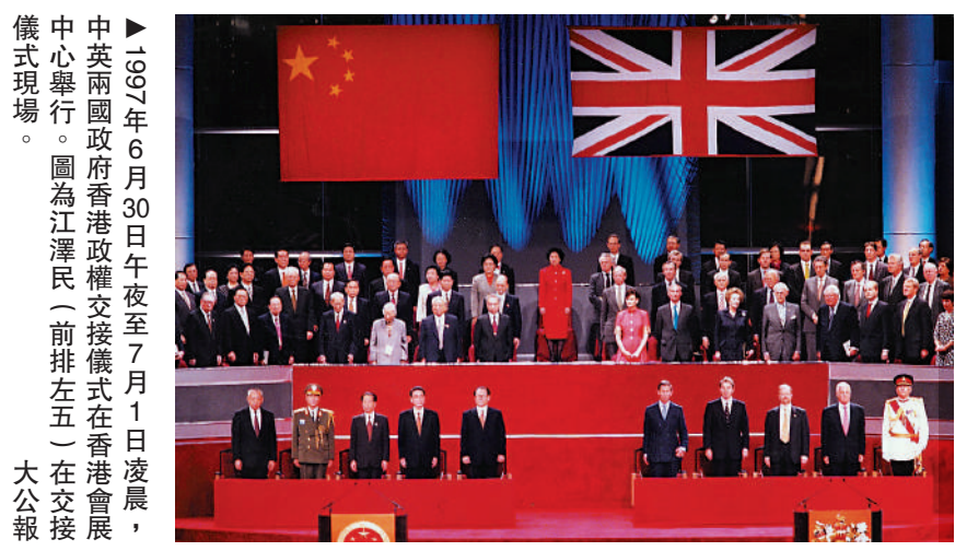
▲1997年6月30日午夜至7月1日凌晨，中英兩國政府香港政權交接儀式在香港會議中心舉行。圖為江澤民（前排左五）在交接儀式現場。