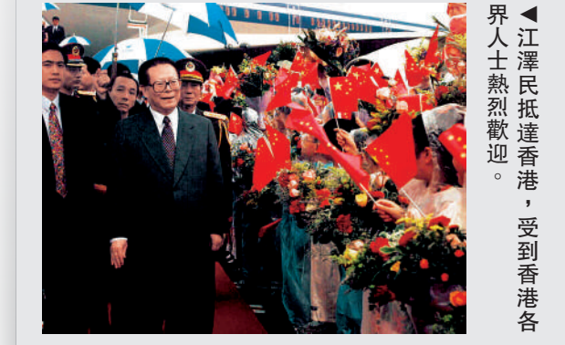
▲江澤民抵港，受到香港各界人士熱烈歡迎。

出席活動 ● 見證香港主權移交，出席中英政府香港政權交接儀式、香港特區成立暨特區政府宣誓就職儀式、香港特區成立慶典等。