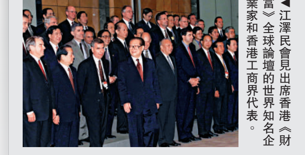
▲江澤民會見出席香港《財富》全球論壇的世界知名企業家和香港工商界代表。