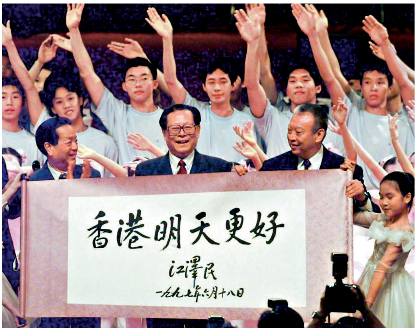
▲1997年7月1日，中華人民共和國香港特別行政區成立慶典在香港會議中心舉行。圖為江澤民親筆題寫的「香港明天更好」書法卷軸。

回歸初期，香港受亞洲金融風波的衝擊而出現了暫時的經濟困難，江澤民多次在公開場合重申中央對港的大力支持，為香港渡過難關、再造輝煌加油打氣。 1998年，在香港回歸祖國一周年慶祝大會上，江澤民擲地有聲地總結指出，香港的命運從來就是同祖國的命運緊密相聯的。當亞洲金融風波襲來之時，中央政府全力支持香港特區政府所採取的應對措施，特別是堅決支持香港特區政府維護香港的聯繫匯率制度，保持香港大局的穩定。這有力地證明，偉大的祖國是香港的堅強後盾。