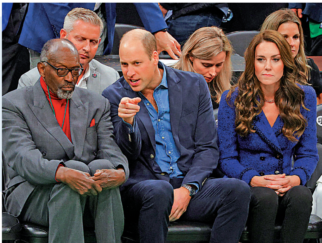
▲英國王儲威廉（中）及王妃凱特（右）11月30日在波士頓看球，有球迷對他們發出噓聲。

【大公報訊】綜合《每日郵報》、BBC、法新社報道：11月30日，英國王儲威廉夫婦隔8年訪美。同日，威廉的教母、已故英女王伊麗莎白二世的貼身侍女赫斯因捲入種族歧視醜聞辭去王室資深助理一職，令威廉夫婦陷入尷尬境地。二人在波士頓觀看NBA球賽時，有觀眾對他們發出噓聲。波士頓環境部主管懷特·哈蒙德更當著他們的面說：「我希望大家都來思考殖民主義和種族主義造成的後果。」法新社稱，英國王室正面臨女王去世以來最嚴峻的考驗。