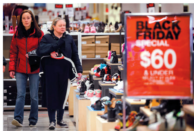
▲紐約首次登上全球城市生活成本排行榜榜首。