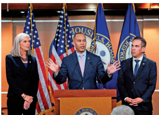
▲傑弗里斯（中）、克拉克（左）和阿圭拉躋身民主黨領導層。

【大公報訊】據美聯社報道：當地時間11月30日，美國國會眾議院民主黨進行黨內選舉，52歲的紐約州眾議員傑弗里斯全票當選眾院民主黨領袖，成為佩洛西的接班人，亦是首位在國會擔任黨派領導人的非裔。馬薩諸塞州眾議員克拉克和加州眾議員阿圭拉分別當選眾院民主黨黨鞭和黨團會議主席，與傑弗里斯組成新一代領導核心。