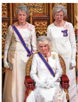
▲赫斯（左）因種族歧視醜聞辭去王室資深助理一職。資料圖片