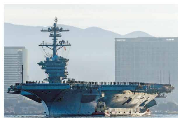
▲林肯號航母11月29日在加州海岸附近起火，事故原因仍在調查中。

徑直向對方駛去。兩年半前，美國海軍兩棲攻擊艦「好人理查德」號在加州海軍基地爆炸起火，造成數十人受傷，該艦最終報廢。美國海軍指控一名水手縱火燒船，但法院於今年9月裁定這名水手無罪。美國智庫里根研究所12月1日公布的調查結果顯示，僅有48%的美國人對軍隊有信心，較2018年的70%大幅降低，主要原因是美國民眾認為美軍過於「政治化」。據美媒報道，共和黨支持者批評美軍被所謂的「覺醒文化」影響，過於看重「多元化」；民主黨支持者則批評美軍內部有右翼極端分子。只有13%的受訪者表示願意入伍。