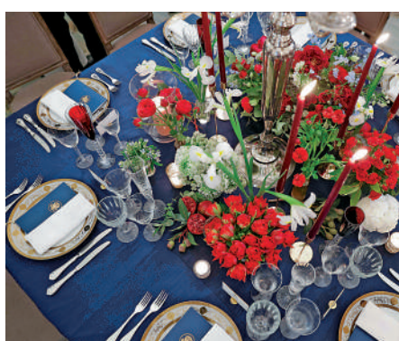
▲用於此次國宴的餐具和桌布等用品都是租來的。