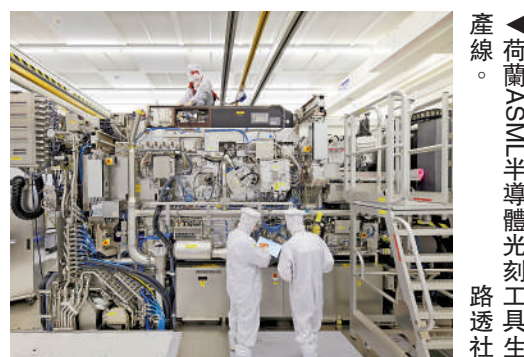
▲荷蘭ASML半導體光刻工具生產線。

此外，阿德里安森還表示，荷蘭對美國向國內企業提供大量綠色技術補貼的措施感到擔憂，稱這將對荷蘭乃至整個歐盟的工業和經濟產生衝擊。西方應該有一個公平的競爭環境和「同一套規則」。