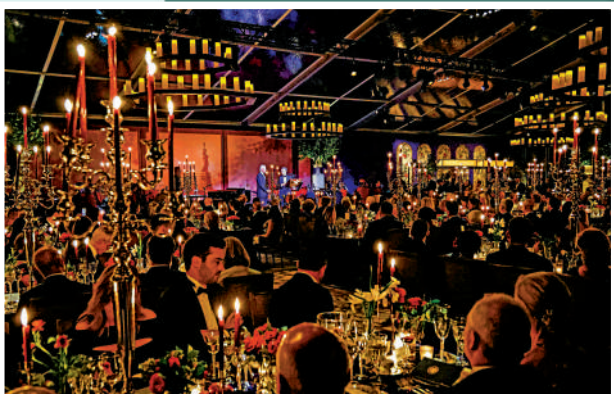
▲1日晚的國宴招待了超過330名賓客。