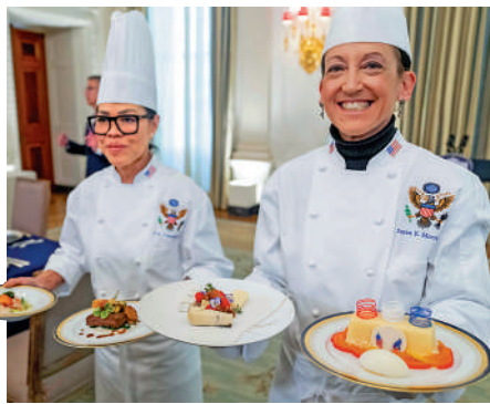
▲白宮廚師向媒體展示國宴上的美食。

【大公報訊】據CNN報導：當地時間12月1日晚，美國總統拜登在巴黎為來訪的法國總統馬克龍夫婦舉辦國宴，這是拜登上任以來舉辦的第一次白宮國宴，特別在白宮搭帳篷舉辦這場招待超過330人的超大型活動。但這場國宴上使用的餐具、餐桌裝飾和桌布，卻都是租來的。對此，白宮社交秘書埃利桑多解釋，雖然此次場地位於白宮內，但負責監督白宮所有藏品使用情況的保管室負責人並不認為臨時搭建的帳篷算作白宮的一部分，因此不允許在晚宴上使用白宮的官方瓷器。