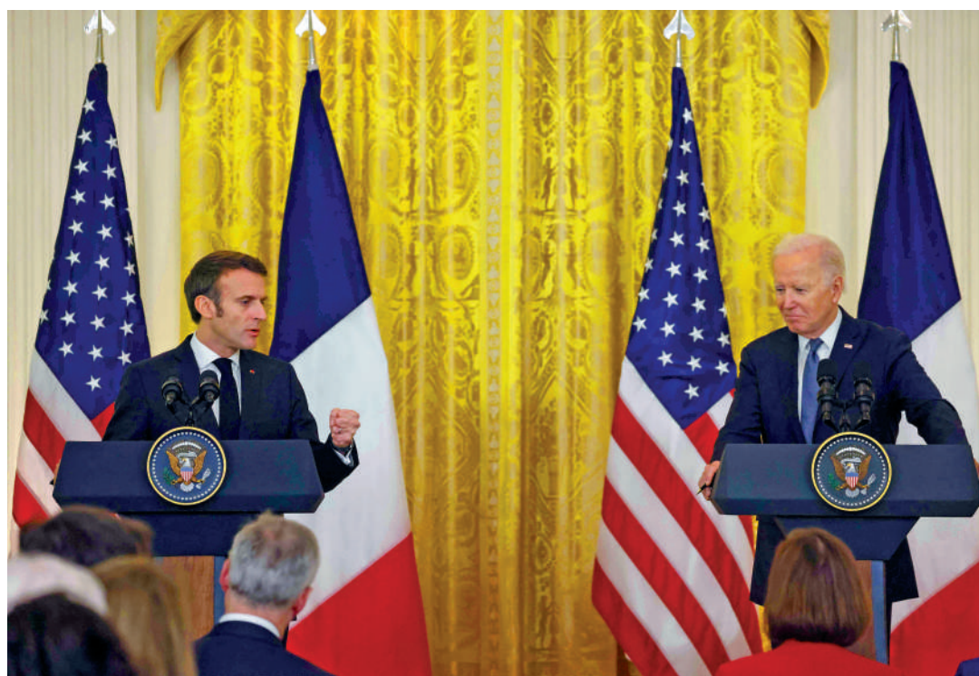
▲美國總統拜登（右）1日與法國總統馬克龍在巴黎舉行記者會。

馬克龍11月29日啟程訪美，是拜登上任以來接待的首次國事訪問。但馬克龍在出訪前及訪美首日都直接對《通脹削減法案》提出了嚴厲批評，直斥該法案的巨額補貼對歐洲企業過於「咄咄逼人」，將扼殺歐洲大量的工作崗位，「分裂西方」。評論稱，馬克龍的表態「撕下了這次精心安排的訪問表面的部分虛飾」。