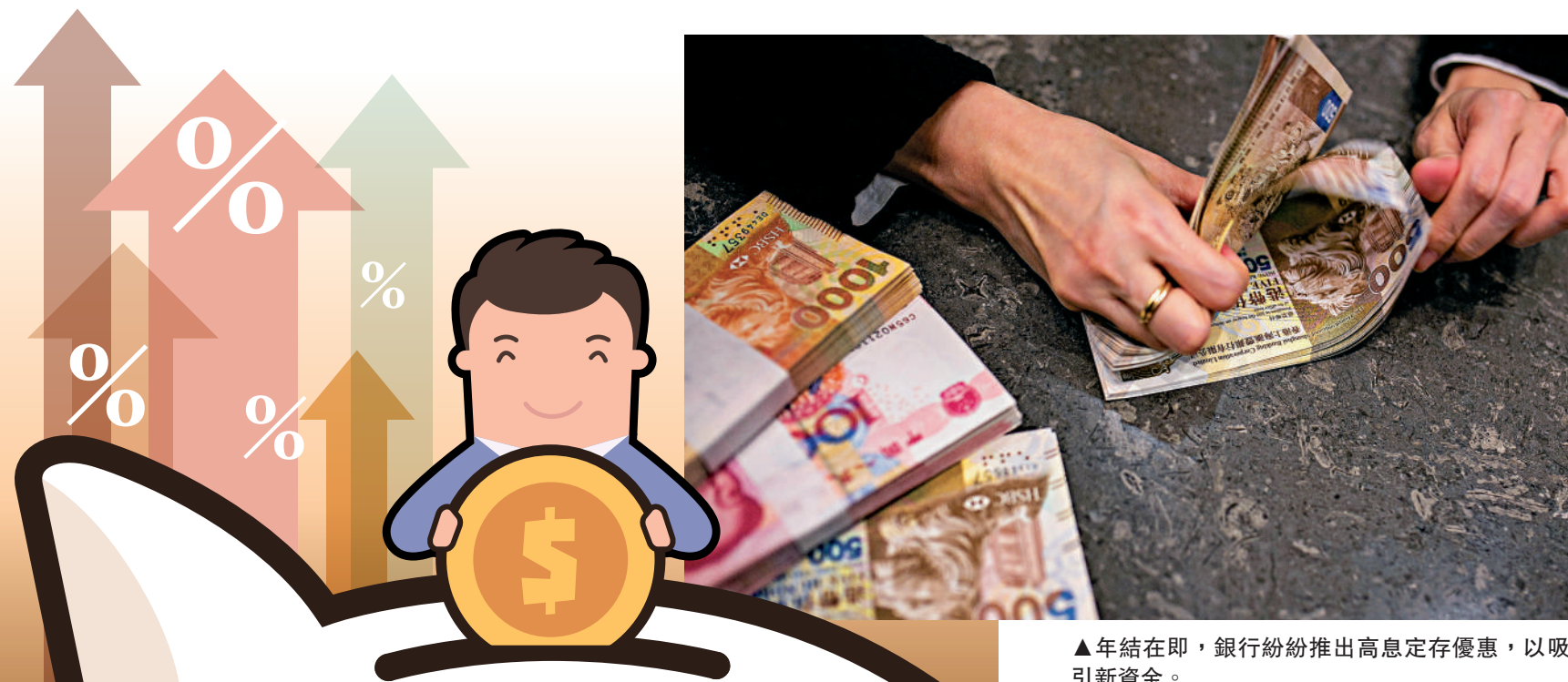
▲年結在即，銀行紛紛推出高息定存優惠，以吸引新資金。

存款保障計劃不只保障港幣，其他外幣存款如人民幣或美元等均受保障，包括往來戶口、儲蓄戶口、用作抵押的存款。但要留意，超過5年的定期存款、結構性存款、不記名存款證、海外存款等，均不在保障計劃內。