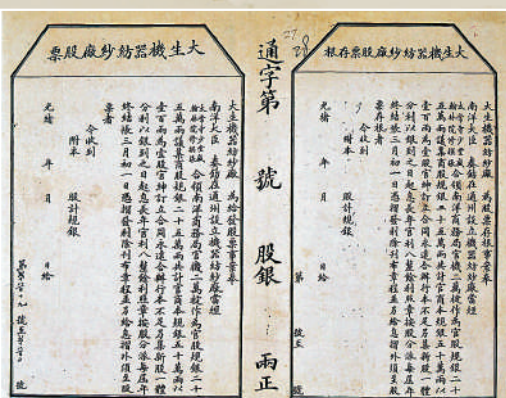
▲現存的晚清大生紗廠股票。