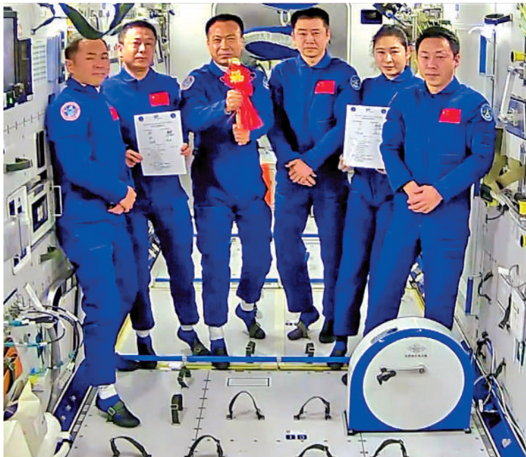
▲神十四乘組與神十五乘組完成了中國空間站歷史上首次在軌交接，費俊龍從陳冬手中接過了空間站鑰匙。

【大公報訊】記者劉凝哲北京報道：「經過近三天的共同生活工作，我們神十四乘組將空間站所有工作交接完畢」，神十四乘組指令長陳冬說。「我代表神十五號，已經過確認，可以簽字」，神十五乘組指令長費俊龍說。兩個乘組隨後完成了中國空間站歷史上首次在軌交接，費俊龍從陳冬手中接過了中國空間站鑰匙。至此，中國空間站正式開啟長期有人駐留模式。史上「最繁忙乘組」神十四號航天员陳冬、劉洋、蔡旭哲即將踏上歸途，預計在今日（4日）晚間返回東風着陸場。