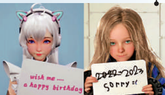
▲騰訊AI宣傳片的虛擬形象（左）疑似抄襲電玩遊戲《虛實萬象》中的角色（右）。

AI繪畫另一大被詬病的問題是「侵權的邊界」，界定真人畫手是否抄襲，是否構成侵權也存在種種複雜的爭議，放到AI繪畫的侵權問題上，或許也需要足夠多的經驗和案例，形成行業認知。