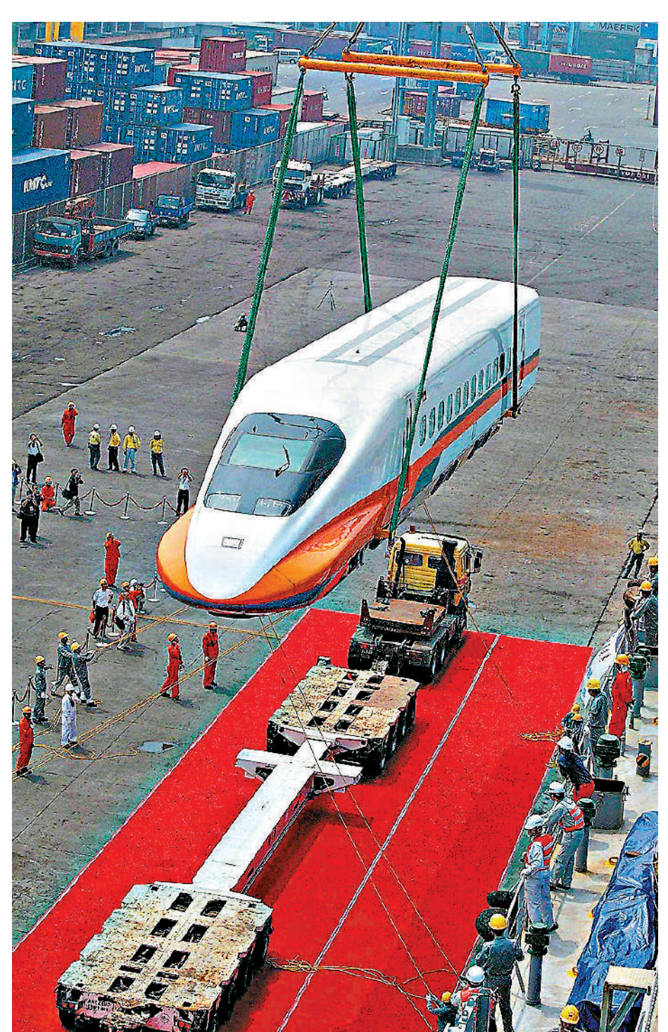
▲2019年台灣高鐵啟動新列車採購計劃，2020年、2021年兩次招標均因日本廠商報價過高而廢標。圖為2004年5月，日本售台首批700T型新幹線列車在台灣高雄港上岸，被吊裝至專用拖車上。

予取予求 【大公報訊】台灣高鐵公司2日發布新聞稿稱，該公司新列車採購案正在進行，尚未定案。這代表針對前日，該公司董事會成員黃茂雄稱，台灣高鐵正與日本方面磋商採購新一代列車。此前，日方開出了一組12節列車50億新台幣（約2.5億港幣）的天價，比市場價高1.5倍，被形容為「用飛機的價格來買火車」。對此，受訪專家表示，美日均視台灣為提款機，目的是要掏空台灣。島內網友則直指，大陸高鐵才是最佳選擇。 綜合中時新聞網、中央社報導：黃茂雄1日晚在日本出席酒會致辭時以台灣高鐵為例稱，將在一兩年內採購新一代車輛，「現在我們雙方代表正在磋商。」不過，台灣高鐵公司次日改稱，購車案正在程序中，尚未定案，「請外界勿作片面揣測」。 採購價為「復興號」三倍 台灣高鐵號稱「歐日混血」，但以日本系統為主，包括列車行車控制和信號系統採用日方專利。台高鐵此前與日方談及採購新幹線N700S列車時，日方開出一組12節車廂50億新台幣（約人民幣11.5億元，相當於大陸「復興號」列車採購價的3倍），是市場價格的2.5倍。這個價格曾被形容「用飛機的價格來買火車」。 由於高度依賴日本技術，2019年台灣高鐵啟動新列車採購計劃後，兩次招標都只邀請日本公司參與投標，分別於2020年2月及2021年1月兩度廢標。台灣高鐵表示，廢標原因是「廠商報價與市場行情差距過大及部分投標文件不符規範」。 今年3月，台灣高鐵公司啟動第3次招標，邀請多家廠商參與投標，有傳聞稱其中包括歐洲廠商。台灣高鐵打算對日本公司說「不」後，日本政客立刻就來。今年8月，所謂「日華議員懇談會」會長古屋圭司竄訪台灣，跟蔡英文等會面時，都提到了台灣高鐵列車採購，極力稱讚日本新幹線是「很好的系統」，更赤裸裸地表示，希望當局能夠協助「圓滿解決」。日「駐台代表」泉裕泰12月1日晚也聲稱，「安全行駛的台灣高鐵，成為日台友好的象徵」。 日本方面把台灣高鐵當成「待宰肥羊」，引發島內輿論不滿。台灣輔大日文系所特聘教授何思慎指出，日方報價超過市場行情，不要說跟廉物美的大