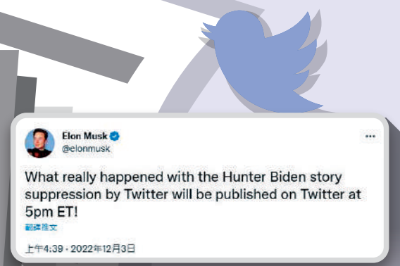
▲馬斯克2日在推特上向公眾預告即將爆料，並表示3日將繼續。網絡圖片