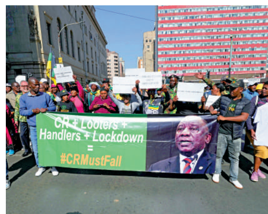
▲南非民眾7月在約翰內斯堡眾議院外遊行，要求調查拉馬福薩貪腐案。

目前，拉馬福薩尚未被指控任何罪名。南非主要反對黨民主聯盟要求提前大選，令執政的非洲人國民大會陷入危機。南非將於2024年舉行大選。國會6日將就報告內容進行辯論，決定下一步行動，有可能展開彈劾聆訊，甚至下台。