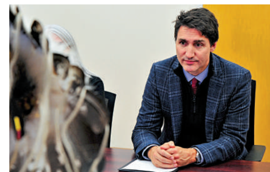
▲加拿大總理特魯多。