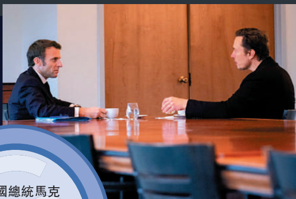
▲法國總統馬克龍2日與馬斯克會面，討論推特內容審核政策。 路透社

此前，據第三方數據機構「網絡傳染研究所」11月10日發布分析稱，馬斯克收購推特的12小時內，用於貶低非裔的種族主義稱謂的引用飆升了500%。