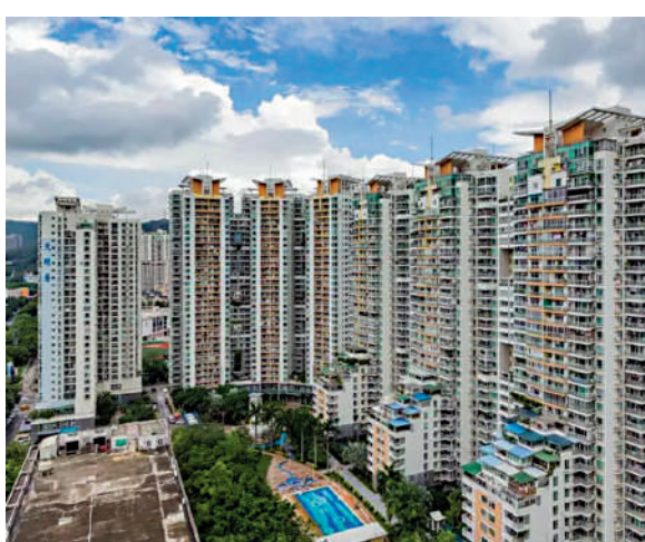
▲天然居於2002年建成，由6幢住宅組成，共提供1056個單位，戶型選擇多。

天然居佔地2.7萬平米，總建築面積16萬平米，由6幢住宅組成，提供1056伙，單位面積由76至138平米，間隔由兩房兩廳至四房兩廳。