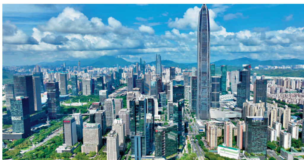
▲福田為深圳重要商業區，中級商廈林立，交通配套完善，福田各片區住宅受買家歡迎。

位處深圳福田中心的景田片區，東鄰蓮花山公園，西望香蜜湖，南靠深圳高爾夫球場，北向下梅林，雖然不是深圳最高檔的居住社區，但基建、民生、商業配套齊全，由幼兒園到高中，由新派咖啡店到傳統老舖，各式商店應有盡有，成為中產置業者的理想聚居地。物業代理透露，區內二手放盤中，每平米售價7萬至9萬元（人民幣，下同）的成交佔約六成，入場費250萬元。隨着政策扶持和舊城改造規劃，區內將有多個高質量新盤落成，吸引新一批外區客進駐。