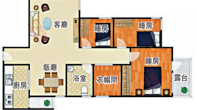
▼108平米三房兩廳戶型圖。