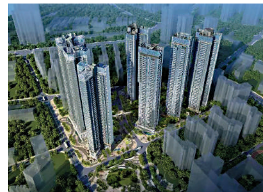
▲天健天驕屬大型舊城改造項目，興建商品房住宅、保障性住房及學校等。

屋苑交通方便，四邊均為地鐵站，西面靠近香梅北站，北面為梅景站，東面向景田站，南面有香梅站，另有數條公車站到達，十分便