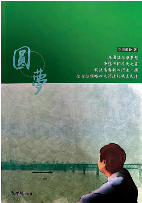
▲在祖國的親身遊歷，就是認識祖國的最好辦法。

總的來看，「讀萬卷書不如行萬里路」的說法很有道理。對祖國的認知，的確是需要身臨其境才好。今時今日，越來越多香港青少年到神州大地旅行，甚至長期就讀就業，真是一件好事。某程度上，這些香港青少年也圓了周齡齡老師父母的教育夢。