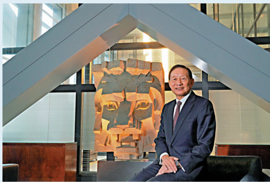
王冬勝建議同時推進傳統優勢產業和新經濟的發展，提升香港對國際人才和跨國企業的影響力。

香港經濟以至整體社會正逐步從疫情中復甦，但仍要面對人才外流、息口攀升，以至內地與香港未恢復正常通關等挑戰。滙豐銀行非執行主席王冬勝說，目前最重要是同步推進傳統優勢產業和新經濟發展，以提高香港吸引力；當香港經濟重拾活力，對國際人才和跨國公司的吸引力也會相應增加。