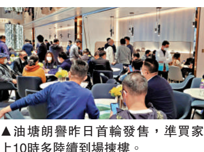
油塘朗譽昨日首輪發售，準買家早上10時多陸續到場揀樓。

成，個別單位造價回到2016年，價錢相對一手吸引，所以近月開賣的新盤銷情未見突出。翻查資料，紅磡必嘉坊，迎上月首輪開賣23伙，即日沽3伙；上月登場的長沙灣連方I首輪推30伙，即日沽7伙。綜合市場資訊，過去周末各新盤共售約16伙。