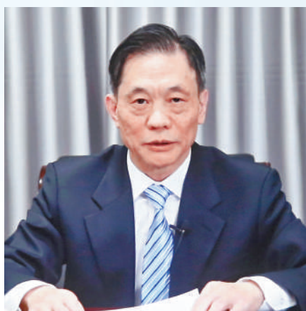
▲ 全國港澳研究會會長鄧中華發表主題演講。

鄧中華表示，憲法是黨和人民意志的集中體現，是國家的根本大法，是治國安邦的總章程，憲法為基本法提供了立法依據和權力來源，憲法與基本法共同構成特區憲制基礎。我國現行憲法頒布實施於1982年，憲法中確立的許多重要制度、原則和規則都源於1954年憲法和1949年《中國人民政治協商會議共同綱領》。