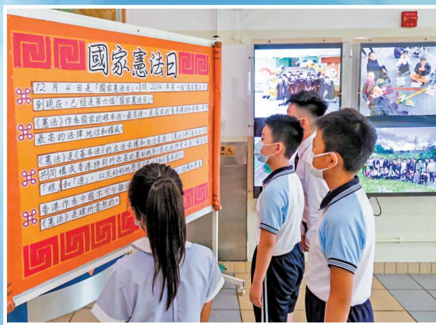
▶ 每年的「國家憲法日」，學校和團體紛紛舉辦認識憲法活動。