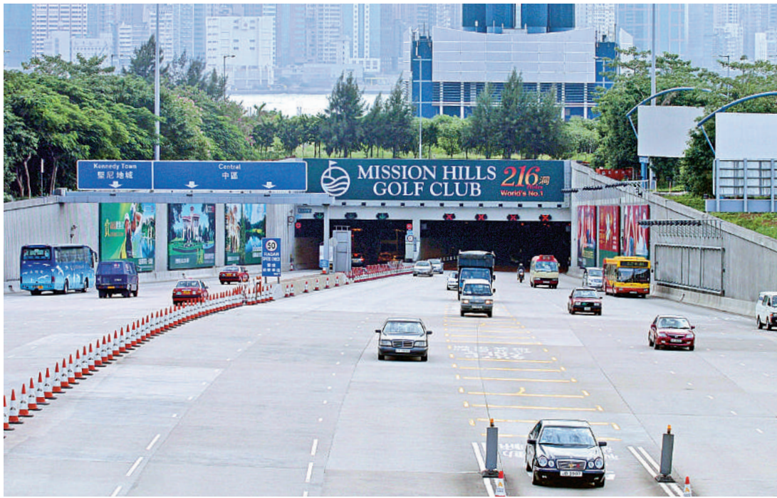
▲政府明年8月收回西隧專營權，屆時將會調整過海收費。

政府建議的三隧分流方案，擬於明年首季修訂相關條例，並由明年8月2日即政府收回西隧專營權當日起，調整三隧收費。就私家車過海收費，西隧擬由現時75元減至60元，紅隧由現時20元加至30元，東隧由現時25元加至30元；對的士則劃一收費25元。其後再於2024年實施「不同時段不同收費」。