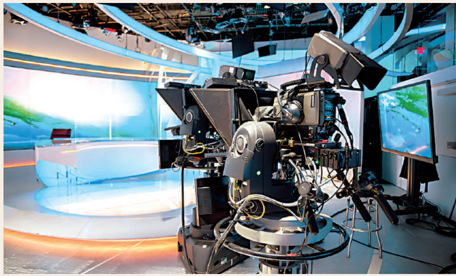
▲隨着數碼技術的發展，電視廣播服務不斷提升質量。

廣播技術改進質與量，節目創作提升吸引力，數碼技術今年逾六十多的地面免費電視保持活力，也提供了更多電訊服務空間，不禁想想若當年採納了限頻道量的英國／歐洲數碼電視廣播標準，今天的香港電視及電訊服務會如何？