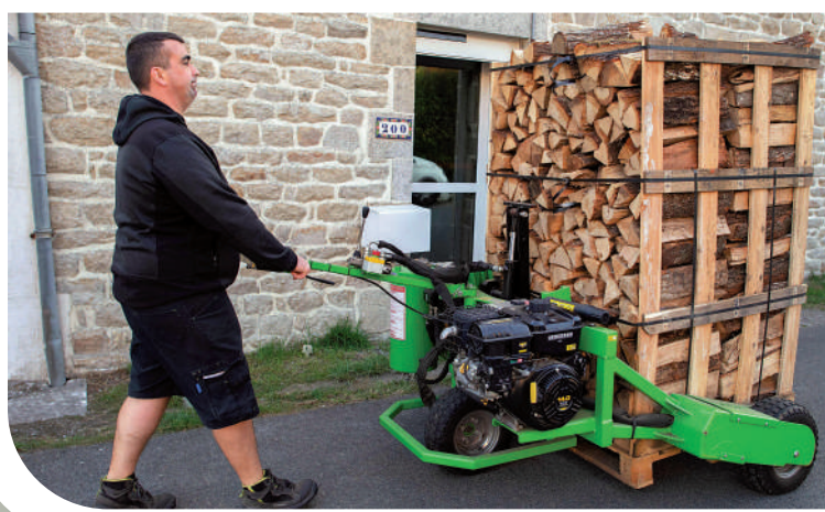
歐洲對俄制裁加劇自身油氣短缺，圖為法國民眾改用木柴。

市場短期內出現供應不足，布倫特原油價格恐在數周內從每桶85美元左右飆升至95美元。另外，歐盟計劃於2023年2月5日禁運俄羅斯精煉石油產品，如柴油等。美聯社指出，歐盟仍有大量柴油車、貨車和農業機械也離不開柴油，禁令生效後歐洲經濟勢必再次遭受衝擊。