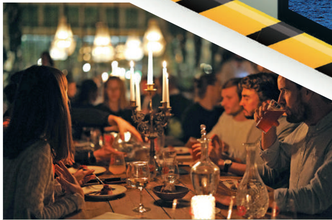
比利時餐廳提前適應沒有油氣的生活，請食客關燈用餐。

11月，波蘭通脹率仍維持在17.4%的高位。一名波蘭公民抱怨說：「我們不知道政府哪來的經費支援烏克蘭人。」