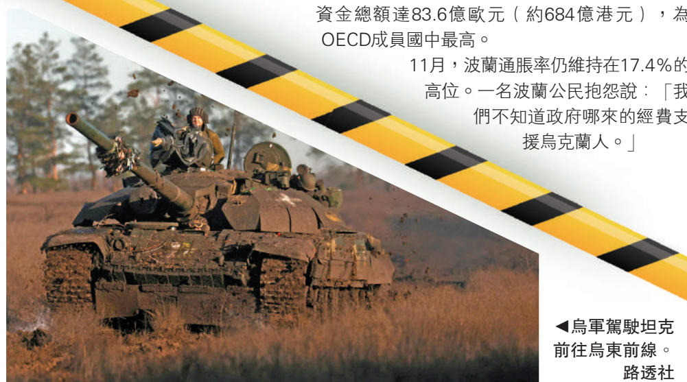
烏軍駕駛坦克前往烏東前線。

烏克蘭方面未宣布對兩次爆炸負責，但有官員稱，一架無人機襲擊了恩格斯基地，導致兩架Tu-95轟炸機受損。