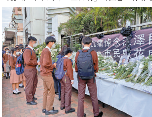
▲近20名來自大澳的佛教徒可中學師生，到中聯辦獻花及悼念。

孔偉成認為，有關安排能增加學生對國家的認識，以及對「一國兩制」的體會，有助培養國民身份認同和愛國情懷。