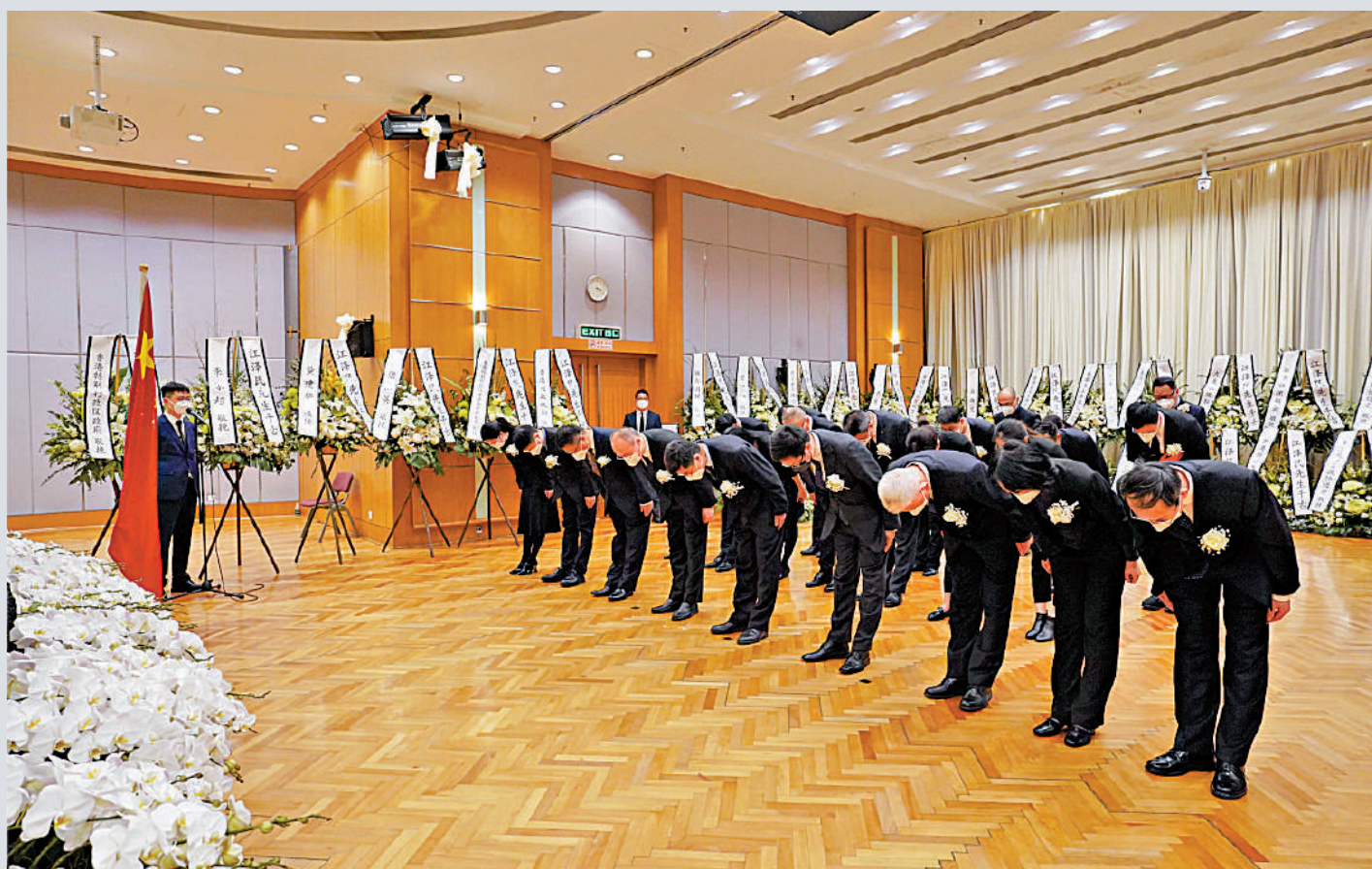
▲中央駐港機構幹部職工集體悼念江澤民同志。