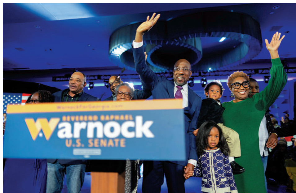
▲佐治亞州民主黨籍參議員沃諾克6日在次輪決選中獲勝，當晚攜家人向支持者致敬。