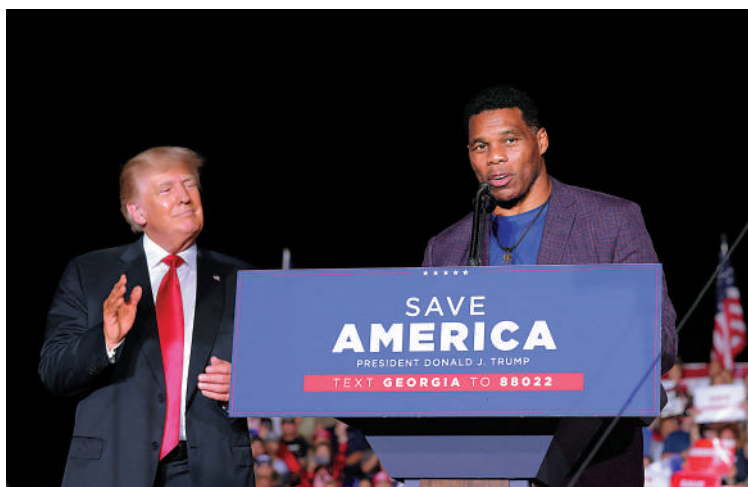
▲特朗普力挺沃克參選，圖為特朗普去年9月參加沃克的造勢集會。路透社

【大公報訊】綜合CNN、美聯社、路透社報道：美國佐治亞州6日舉行國會參議員次輪決選投票。民主黨候選人沃諾克擊敗共和黨對手沃克成功連任，使得民主黨在參議院佔據51席，力壓佔據49席的共和黨，成為真正多數。前總統特朗普力挺的沃克此番敗選，是特朗普競選連任之路上吃的又一敗仗，這可能加劇共和黨內部分裂。此外，曾經的紅州佐治亞將在2024年大選中成為關鍵搖擺州的可能性愈發明顯。