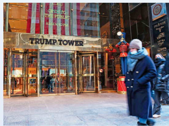
▲位於紐約的特朗普大廈。

格今年夏天同檢方達成認罪協議，隨後出庭作證指控特朗普集團以換取承諾給他的5個月監禁的量刑。特朗普不是本案被告，但是檢察官指控他「確切知道發生了什麼」，特朗普和他的律師則否認這一點。