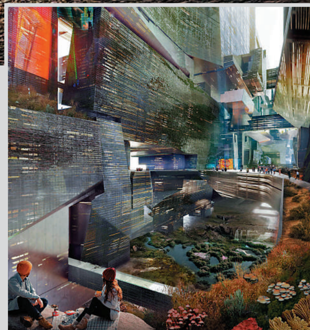
▲「線」城內不設行車道，以走廊連接不同的建築。