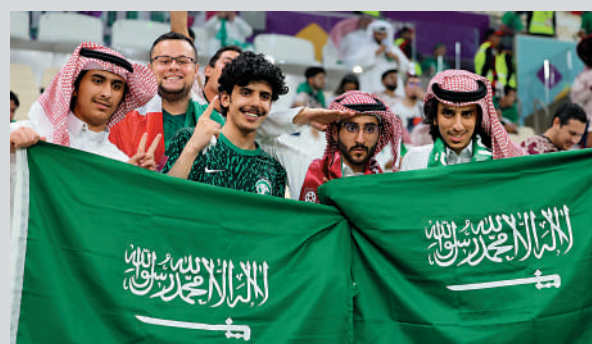
▲沙特有意申辦2030年世界盃主辦權，圖為11月30日卡塔爾世界盃小組賽場的沙特球迷。

受卡塔爾舉辦2022年世界盃影響，沙特有與興趣聯合埃及和希臘申辦2030年世界盃，如果成功的話，將會是首次跨洲舉辦的世界盃，有助推動當地旅遊業發展。