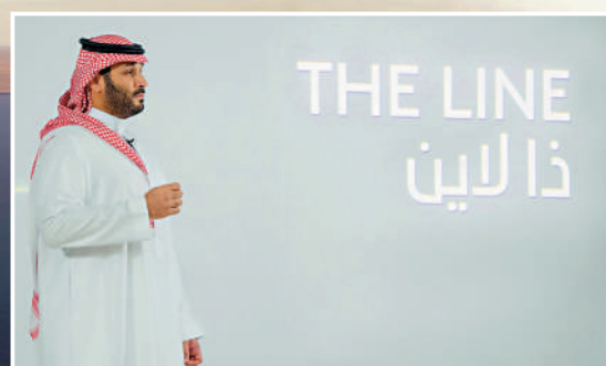
▲2021年1月，沙特王儲穆罕默德介紹「線」城項目。