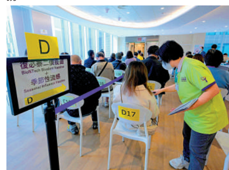
▲年滿18歲人士可由明日起，預約復必泰二價疫苗作為第三針。

另外，政府昨日公布，下周五起增設位於元朗文化康樂大樓外空地的元朗社區疫苗接種站，市民於明日（9日）上午9時起可網上預約相關接種服務。