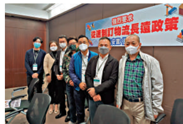
▲棕地作業者希望政府可以「先安置，後收地」，否則要面臨結業危機。

政府預計新界1600公頃的棕地，將有一半會被收回作重新發展之用，而當中部分物流業用地的棕地作業者，未獲政府適當的重置安排，面臨結業危機，有業界代表稱難以自行覓地，而政府提供的出租土地有多重限制，難以配合經營，希望政府「先安置，後收地」。立法會議員表示，北部發展亦應照顧就業，建議政府提供一站式支援。