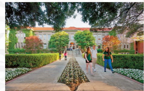
▲拉文大學的電子商務專業由多個跨學科課程組成，讓學生畢業後可作多元發展。

18個學時的先導課、32個學時的核心課程、12個學時的專業課和4個學時的選修課。考生需要在學校的網站完成線上申請，並提交報名費、個人陳述、成績單、推薦信和官方考試成績等，學校將評估考生的經歷和參與度，包括成績單、性格、個人思考和看法等，作為錄取參考。