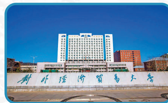
▲對外經濟貿易大學以「國際化複合型人才培養模式」享譽國內。