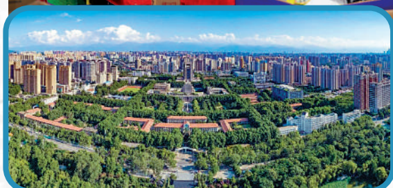
▲西安交通大學的電子商務專業，在2022軟科大學專業排名第二。