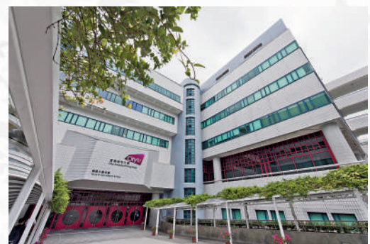
▲香港城市大學的計算金融和金融技術理學士課程，涵蓋電子商務知識。

修讀有關專業的學生還可以申請修讀香港城市大學—美國哥倫比亞大學雙聯學士學位課程。學生在完成雙聯學士學位課程後，畢業時將分別獲得兩所大學所頒發的學士學位。通過香港中文文憑試報名的考生，須在中文、英文、數學、通識達到3分、3分、4分、2分，並於兩個選修科目中不低於3分。