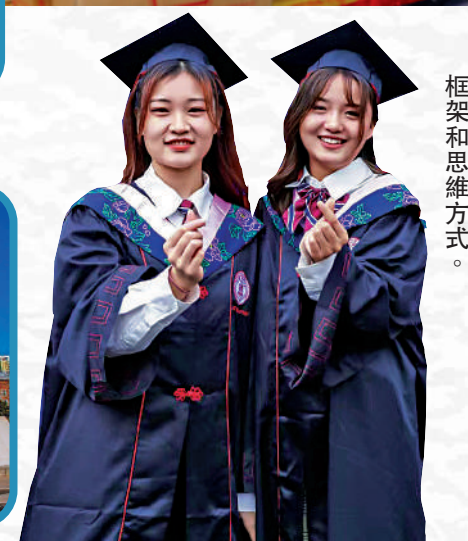
▲上海財經大學的電子商務課程，引導學生建立科學的電子商務分析框架和思維方式。