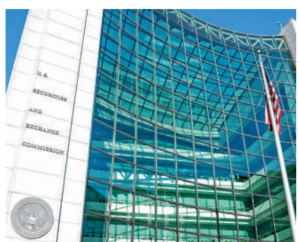
▲美國證監會發布新指引，要求上市企業披露投資加密貨幣情況。

Meta今年以來斥巨資押注元宇宙發展，從第三季業績顯示，業務回報卻不理想，其市值因而蒸發數千億美元。不過Meta仍認為，到2031年元宇宙對經濟貢獻的價值可能超過3萬億美元，而web3技術的採用和利潤將大幅增加。Meta行政總裁朱克伯格