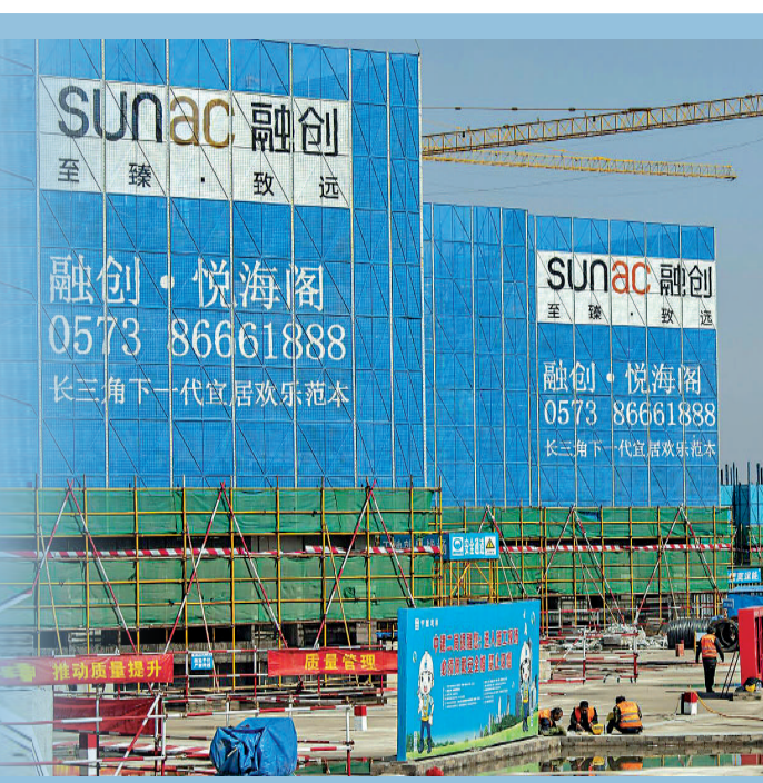
融創稱，將繼續積極與債權人小組磋商，以盡快形成重組方案。