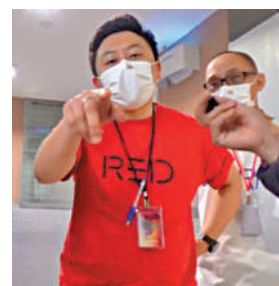
▲華滙物管人員之前曾多次粗暴阻礙大公報記者採訪，不時以粗言穢語辱罵。