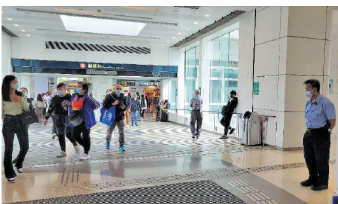
▲apm物管人員會驅趕在連接港鐵觀塘A出口行人天橋上擺賣的攤檔，但不會封橋，市民進出自如。