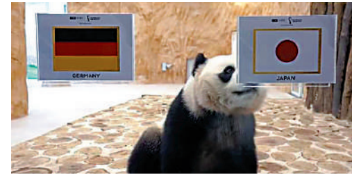
▲大熊貓「京京」估中日本爆冷擊敗德國。網絡圖片

至於最厲害的世盃估賽果「神獸」，非「保羅」莫屬。牠源自德國奧伯豪森一間水族館，在南非世盃百發百中，尤其「日耳曼軍團」全中，也貼中西班牙捧星。接着2014巴西世盃，迪拜的駱駝「沙謙」登場成功預測俄羅斯首仗打敗阿爾及利亞。2018俄羅斯世盃，東道主的海豚「米耶」、蘇連舒高和德國小象尼利出馬，可惜「戰績」都未如人意。