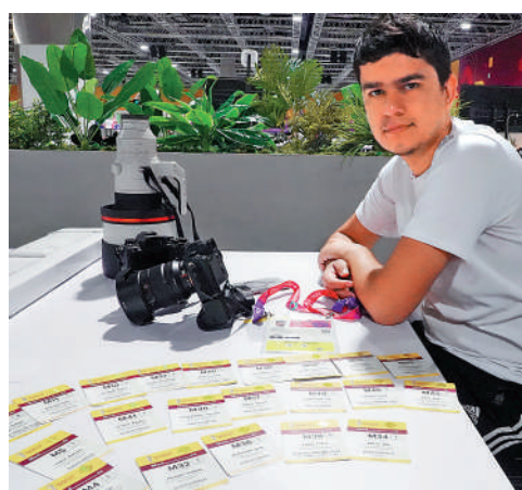
攝影記者Umarov認為今屆世盃工作特別辛苦。