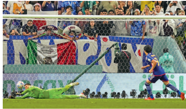
▲克羅地亞在16強對日本（藍衫）以12碼決勝。資料圖片