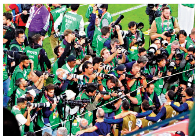
攝影記者拍攝到好照片可以讓那些動人時刻永遠保留。大公報特派記者郭正謙攝