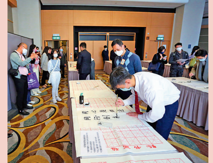
▲頒獎典禮後，筆會現場一景。