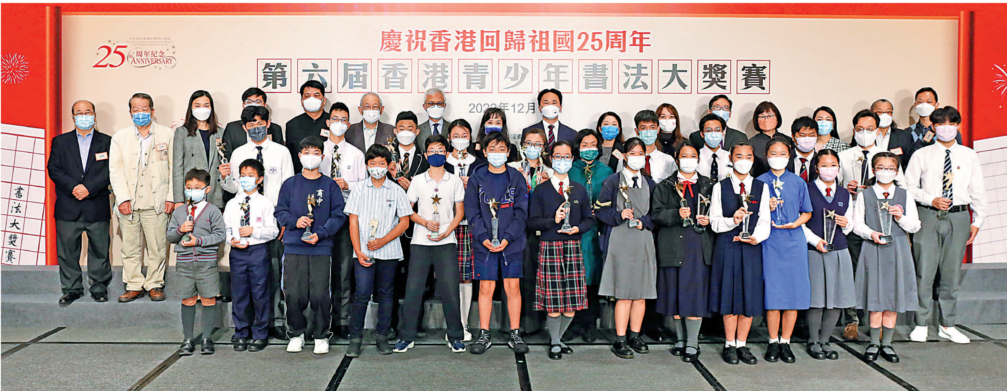
▲由香港大公文匯傳媒集團、中國書法家協會聯合主辦的「第六屆香港青少年書法大獎賽」在灣仔會展中心舉行頒獎典禮，出席嘉賓與得獎者合影留念。

由香港大公文匯傳媒集團、中國書法家協會聯合主辦的「第六屆香港青少年書法大獎賽」，於昨日（10日）在灣仔會展中心舉行頒獎典禮。今屆比賽共收到全港近200所中小學校逾3000幅學生參賽書法作品，共評出毛筆組及硬筆組特等獎、一等獎、二等獎、三等獎及優異獎共212幅作品，以及最踴躍參與學校獎、影響25周年青少年對傳統文化的深刻認知、適逢香港回歸祖國25周年，參賽者亦是以書法作品表達慶祝香港回歸祖國的主題情懷。