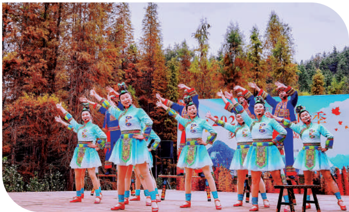
▲在廣東天井山國家森林公園，精彩的瑤族歌舞表演。

因疫情錯過了秋天紅葉的民眾，現在可彌補遺憾，南粵賞紅葉正當時！廣東省林業局10日在廣東天井山國家森林公園啟動第四屆森林文化周冬季系列活動；並發布「南粵紅葉十大觀賞點」名單，40%位於灣區城市，涵蓋了素有「廣州香山」美譽的石門國家森林公園，港人北上可跟着這份「紅葉地圖」探尋南粵別樣的紅葉風光。在這些觀賞目的地中，紅葉如赤橙黃紫的染料潑灑在連綿山川，斑駁絢爛；遊客登高望遠，乘勢而上開山河。