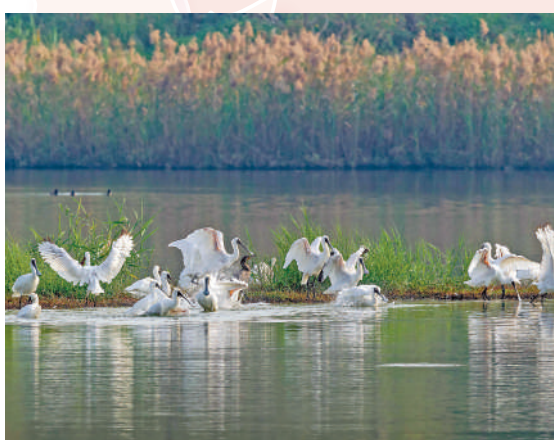
▲廣東吸引大批候鳥落腳「歇息」越冬，估計將達30萬隻以上，圖為黑臉琵鷺。