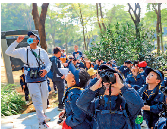
▲青少年學生在廣東的觀鳥自然教育徑「沉浸式」體驗。