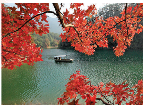
▲廣東牛魚嘴原始生態風景區。