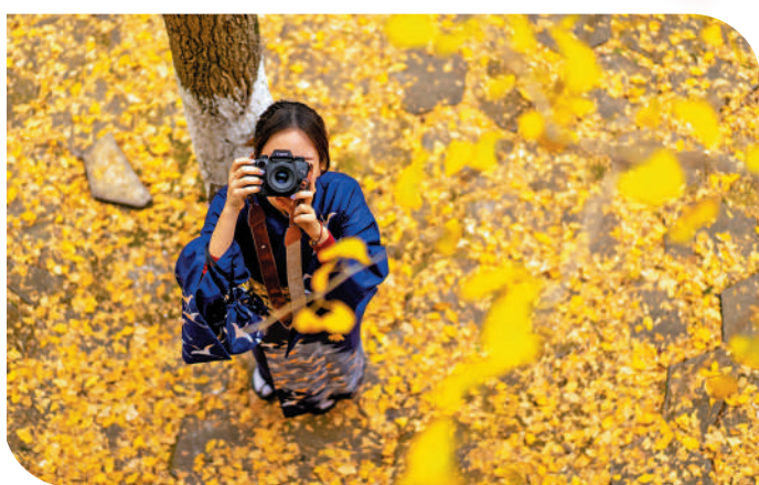
▲南粵迎來別樣紅葉風光，圖為遊客賞葉打卡留念。