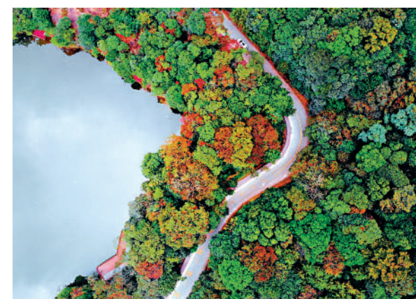
▲廣東石門國家森林公園素有「廣東香山」的美稱。