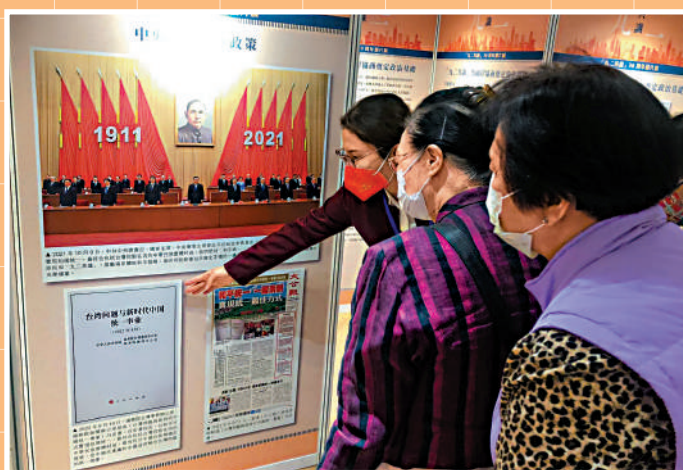
「九二共識」30周年圖片展的講解員為前來參觀的香港市民講解圖片內容。