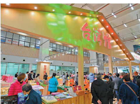
▲第十七屆兩岸林業博覽會暨投資貿易洽談會近日在福建省三明市開幕。

和農林業高質量發展，推動兩岸鄉村融合發展的具體探索和實踐。隨着試驗區的設立，地處閩西和閩西北的這個內陸山區市，先行先試，推動兩岸鄉村融合發展。三明與台灣地緣近、史緣久、血緣親、文緣深、語緣通、神緣合、俗緣同、高緣廣，兩地鄉村在文化傳承、地理環境等方面相似，融合互通性好、產業互補性強。