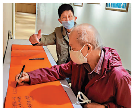
▲參觀「九二共識」30周年圖片展的香港市民在留言簿寫下參觀感受。

「九二共識」30周年圖片展共展出84幅展板，通過逾300張珍貴圖片和詳細的文字敘述，生動再現兩岸關係和平發展歷程。