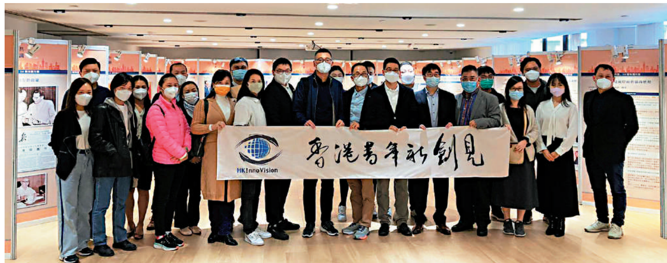
▲青年團體「香港青年新創見」會員參觀圖片展，了解兩岸關係發展歷程。