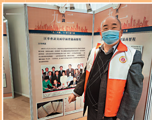
香港市民傅先生稱讀圖片展內容豐富。