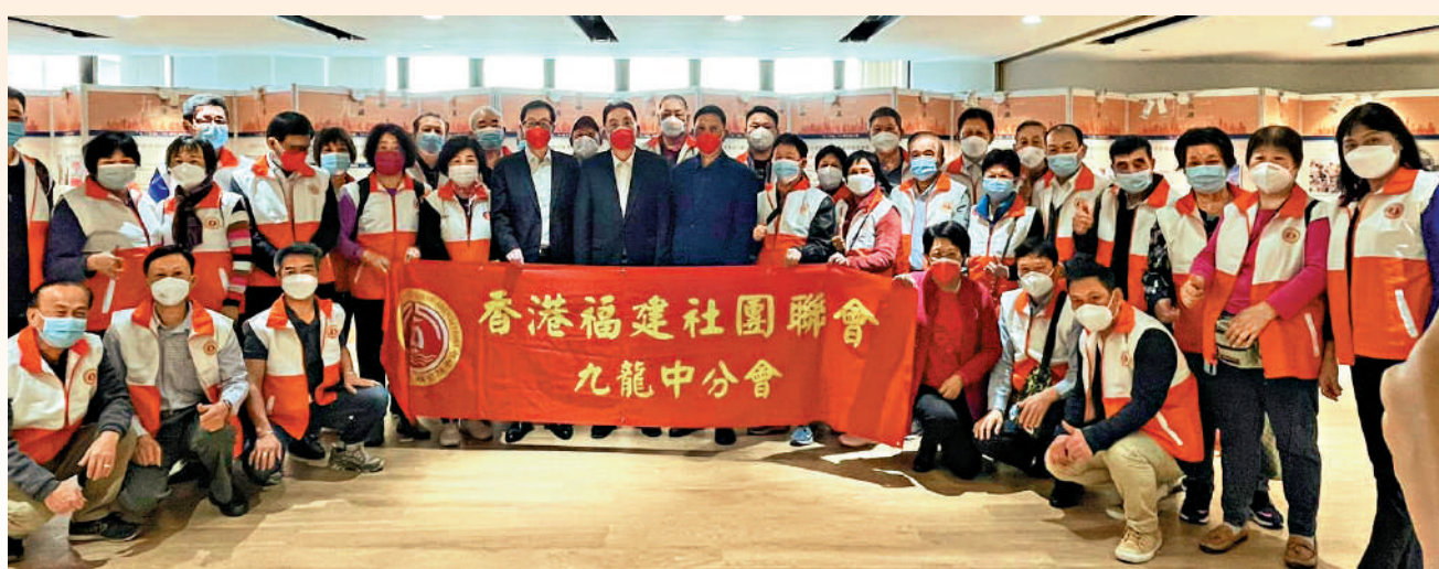
▲香港福建社團聯會九龍中分會組織會員參觀圖片展。