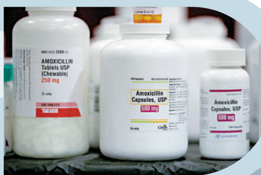
▲美歐多國出現阿莫西林等抗生素短缺。