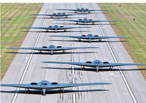
▲美國僅擁有20架B-2轟炸機。

據美國CNN網站報道，B-2轟炸機是目前全球最昂貴的戰機，估計每架造價超過24億美元(約187億港元)，1997年首批6架B-2轟炸機正式服役，迄今共生產21架。B-2轟炸機的主要任務是執行美軍的穿透攻擊行動，在戰爭中深入敵方領土，進行包括投擲核武等各式攻擊行動。