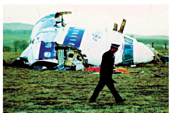
▲「洛克比空難」共造成270人死亡，其中一名嫌犯時隔34年被美國政府拘留。

禁，2009年因癌症末期獲假釋，2012年在利比亞去世。邁格拉希一直堅稱自己無辜，2021年1月，他的家人在蘇格蘭上訴失敗，他們要求英國當局解密空難文件，據悉這些文件內容將矛頭指向伊朗，稱「洛克比空難」是對1988年7月美國海軍擊落伊朗客機，造成290人死亡的報復行動。