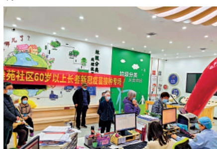
▲廣州白雲區下屬社區設置60歲以上長者新冠病毒疫苗接種專場，提供便民服務。

此外，內蒙古鄂爾多斯市、青海玉樹州、四川宣漢縣、山西文水縣等市、縣也於近日提出了明年1月底前，80歲以上人群第一劑接種率90%的目標。